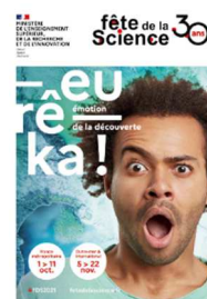
Affiche de l'édition 2021

La nouvelle formule de la 8 e édition a séduit tous les participants. Cette 9 e édition regroupera donc à nouveau sur un lieu unique, le MoCa de Montgaillard , les 216 participants (collégiens, lycéens et étudiants), en duplex avec la Cité du Volcan, 36 coaches, les partenaires, les conférenciers et une 100aine d'encadrants.