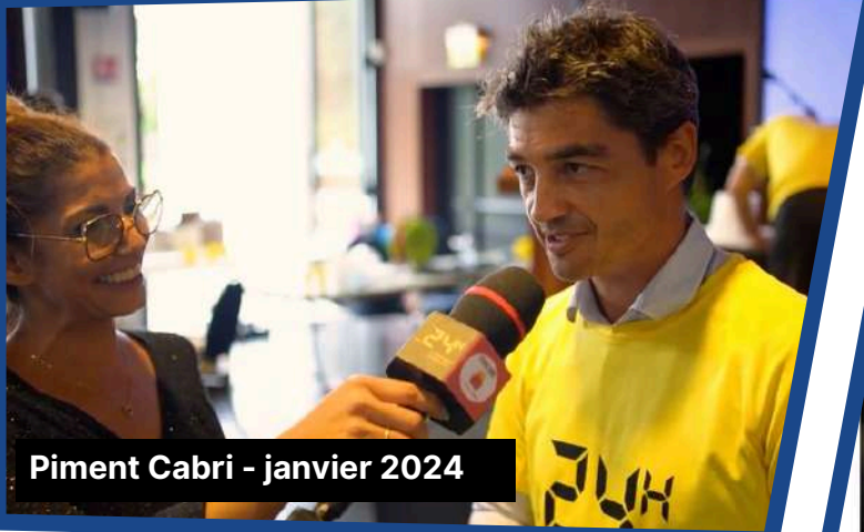
Piment Cabri - janvier 2024