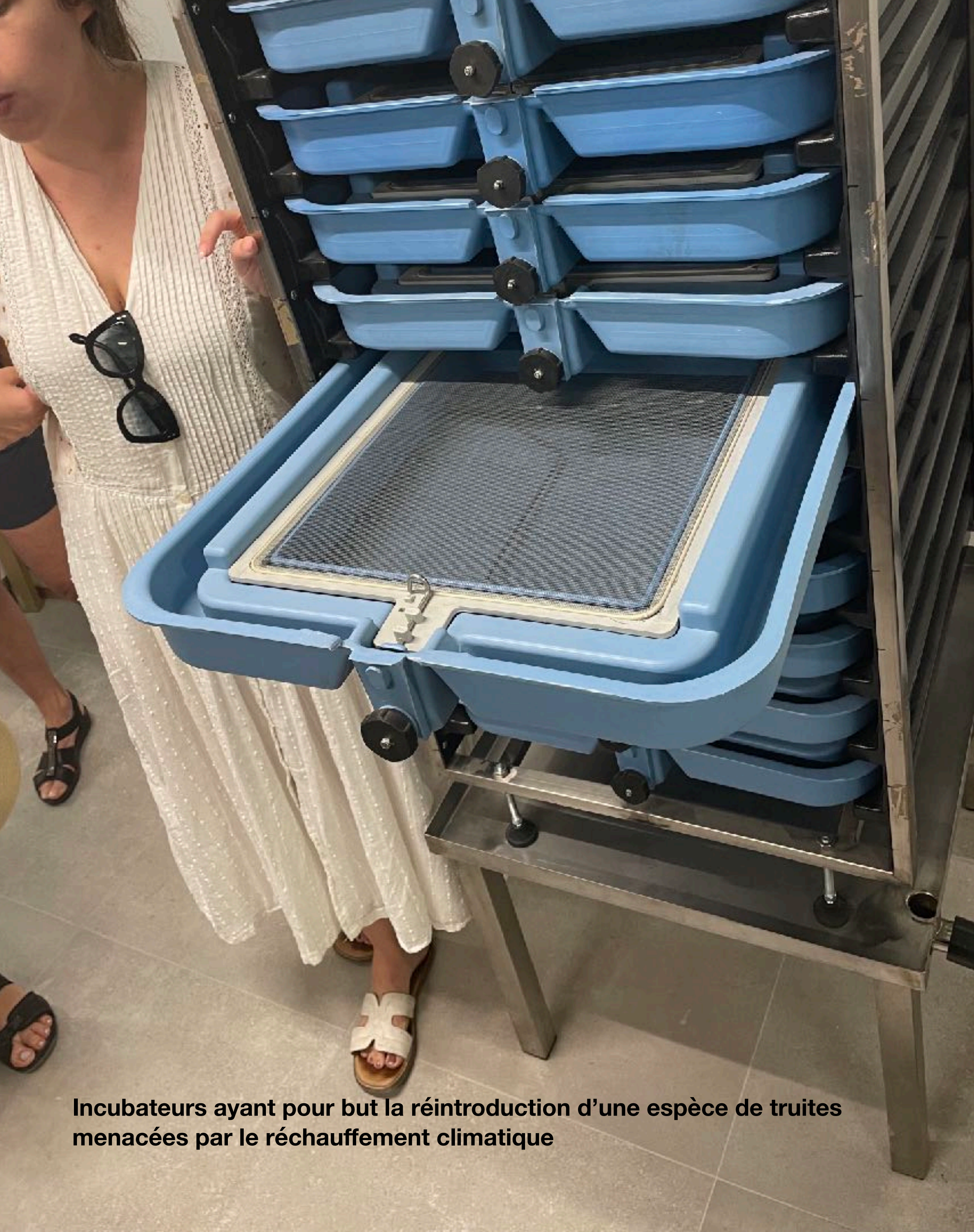
Incubateurs ayant pour but la réintroduction d'une espèce de truites menacées par le réchauffement climatique