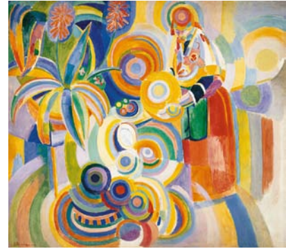
Femme portugaise. 1916

Il repeint plusieurs fois la tour Eiffel car la « géante » se prête bien à ses recherches sur les contrastes simultanés de la couleur.