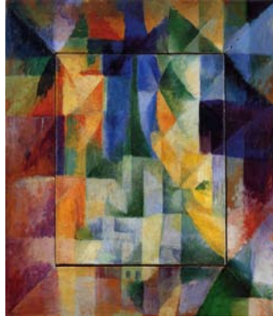
La fenêtre. 1912