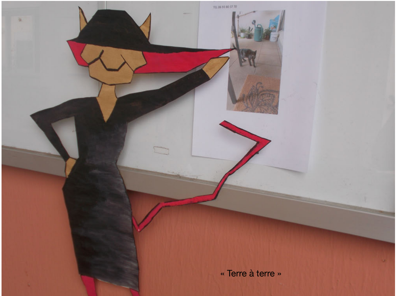
« Terre à terre »