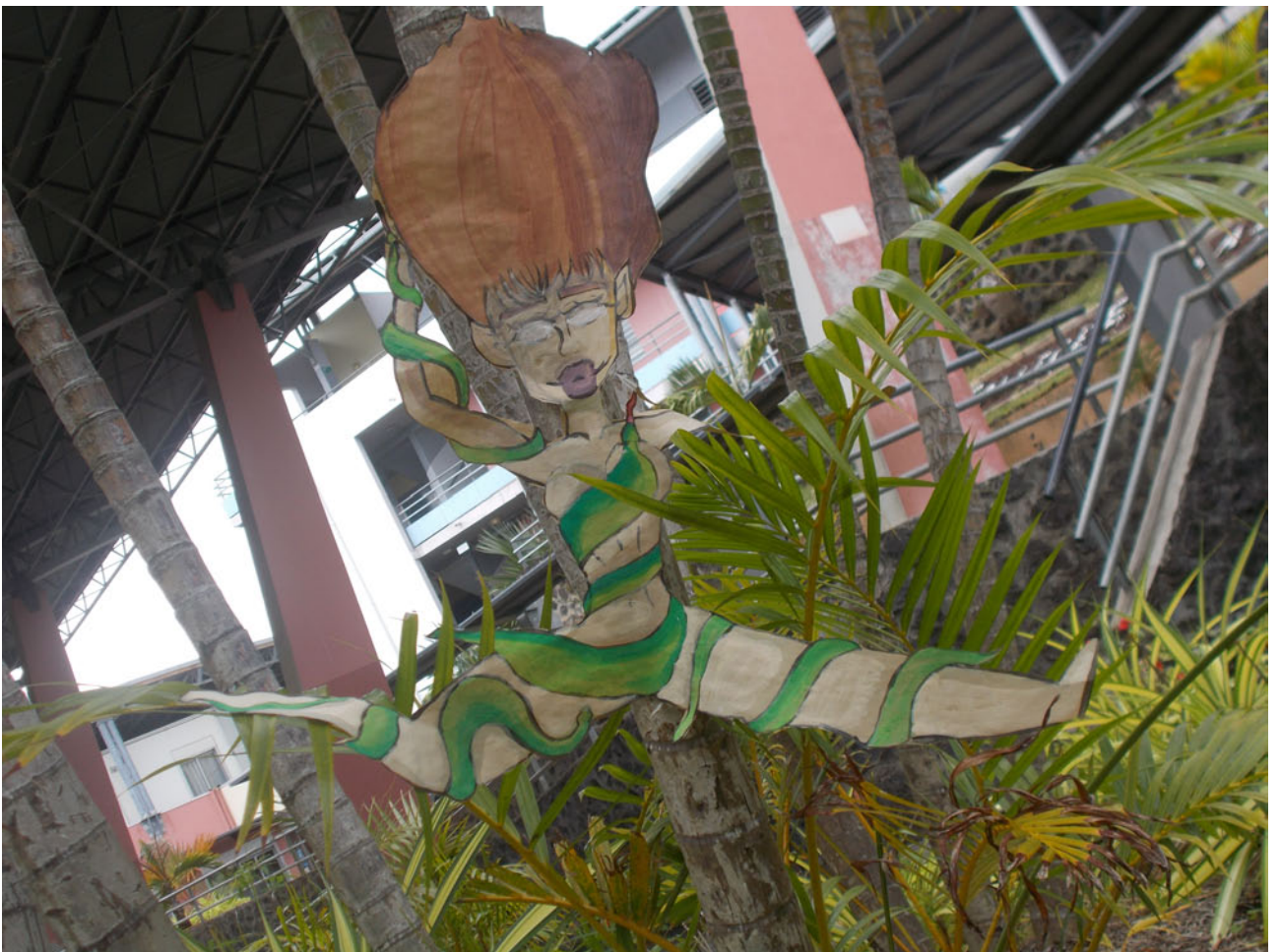
« La dresseuse de serpents »