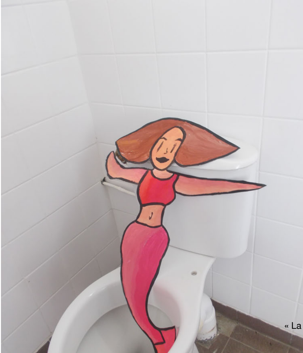
« La sirène des canalisations »