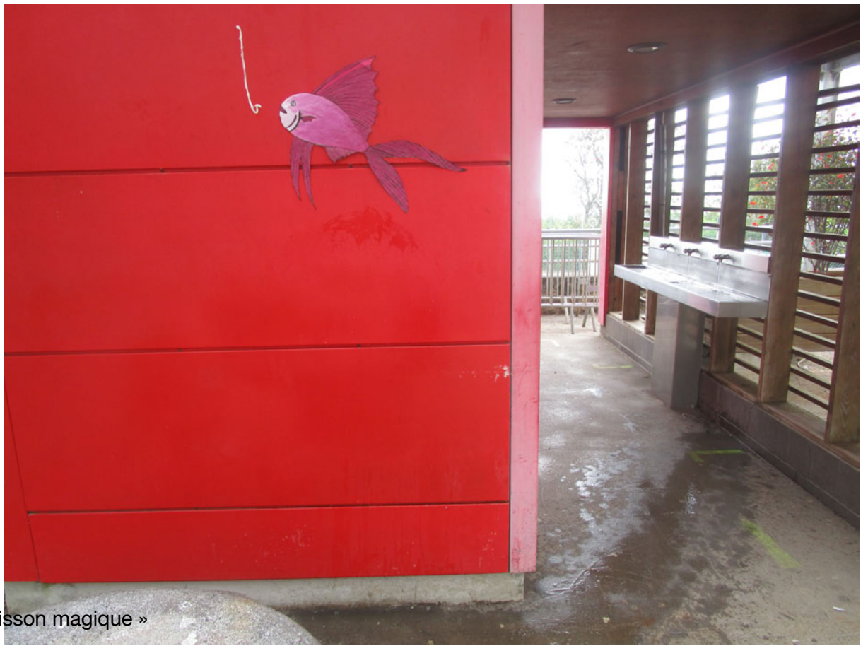
« Le poisson magique »