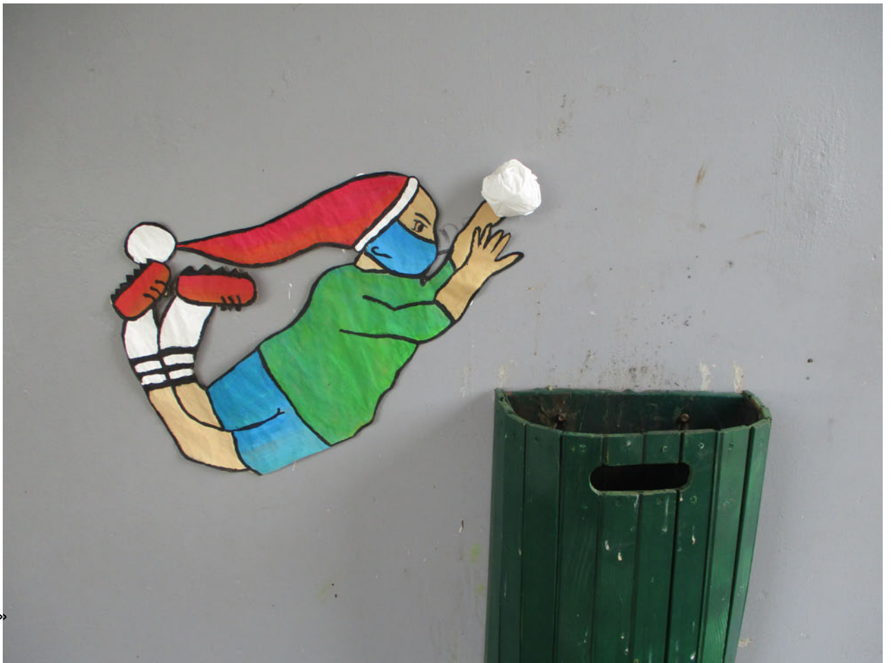
« Le cadeau »