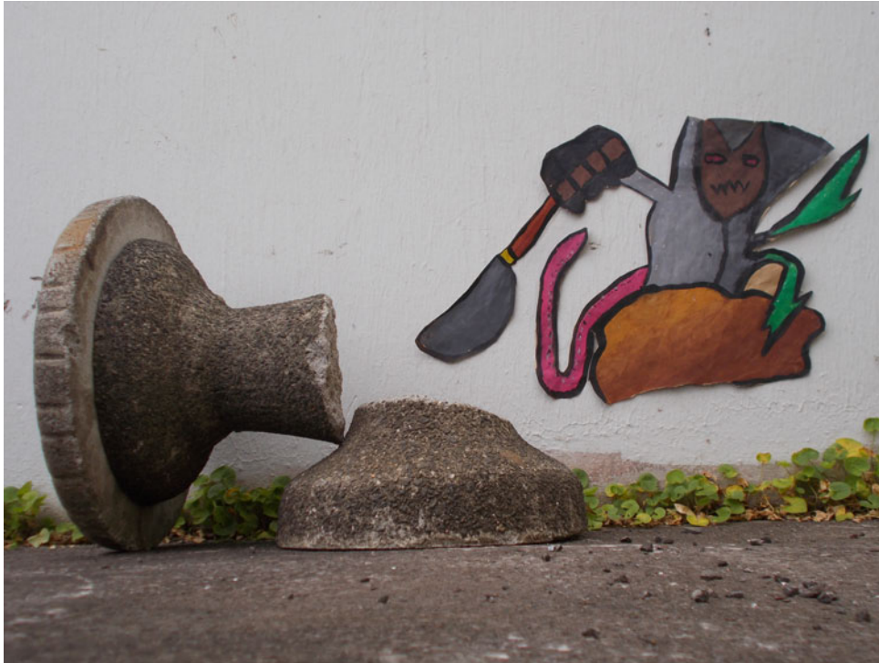
« Le ninja céleste »

Installations « in situ », mise en scène de personnages réalisés en peinture par des binômes. Photographies (niveau 4eme).