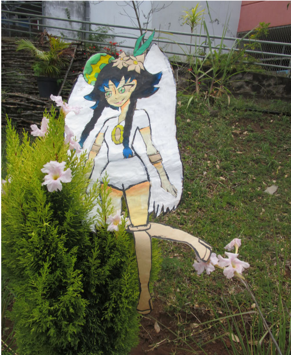
« La fée des fleurs »