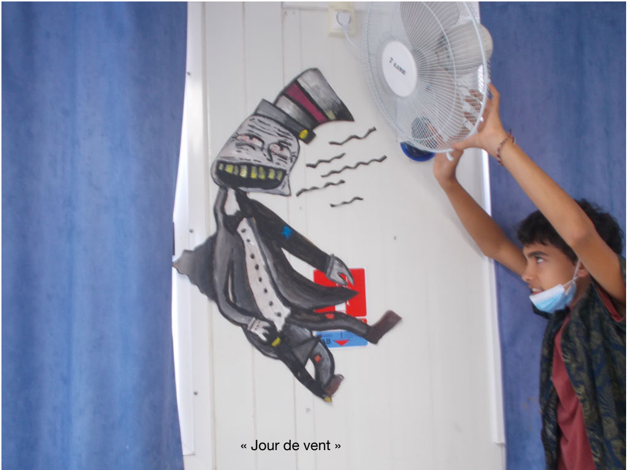
« Jour de vent »