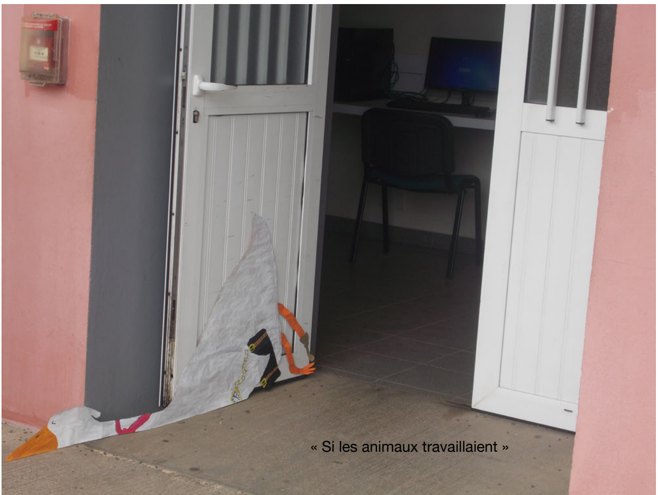
« Si les animaux travaillaient »