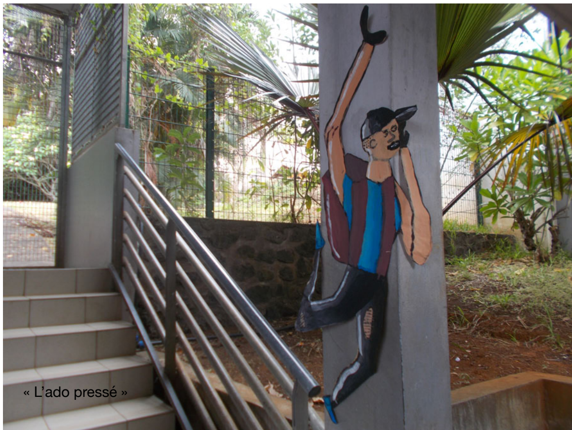
« L'ado pressé »