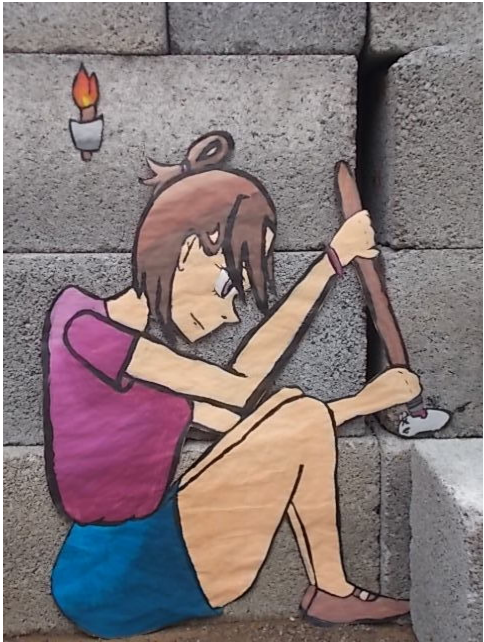
« Opération dératisation »