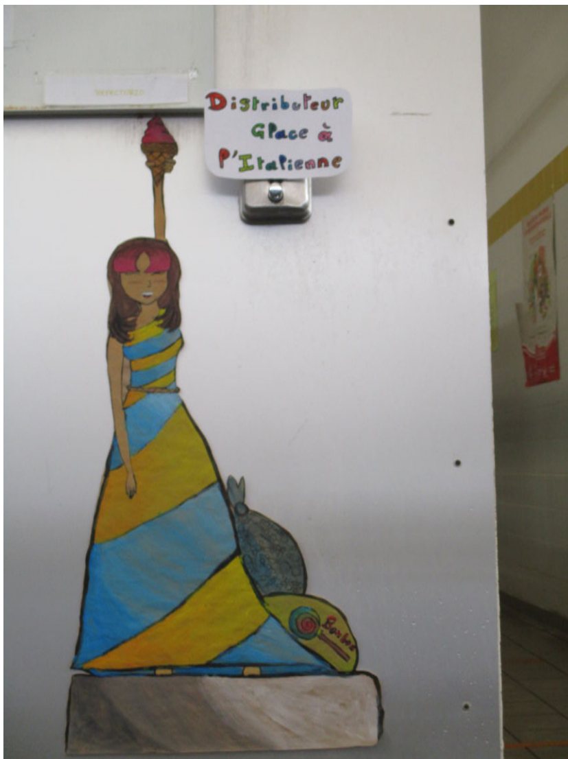
« Glace à l'italienne en folle »