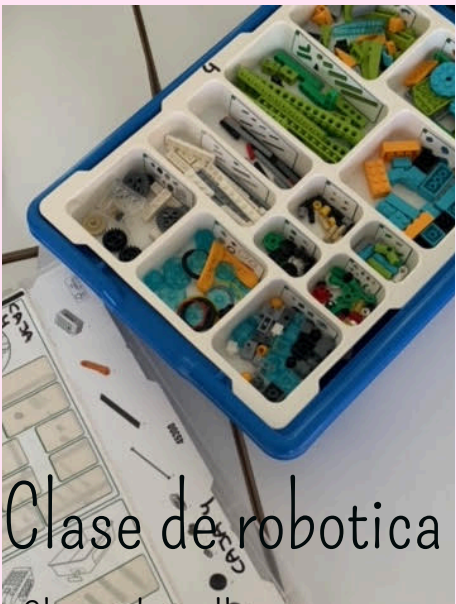
Clase de robotica

Slogan du collège cette année "Compte sur moi"