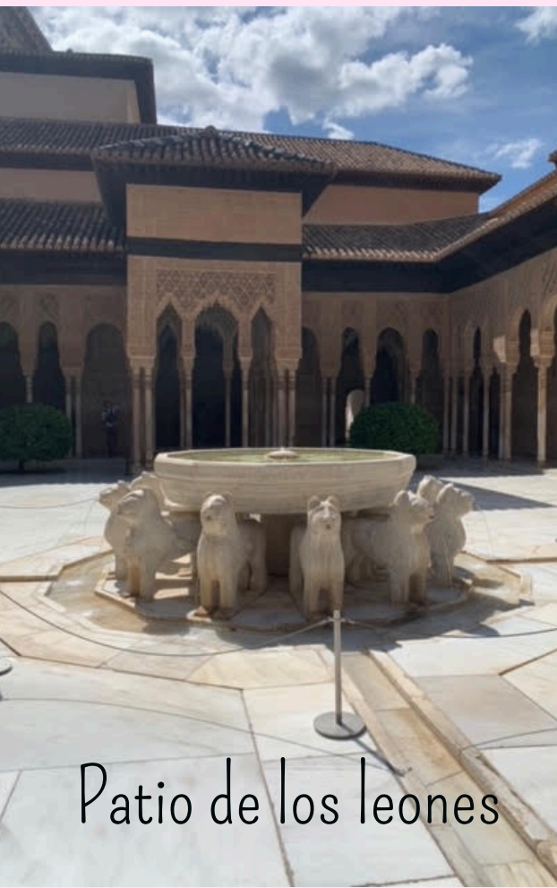
Patio de los leones