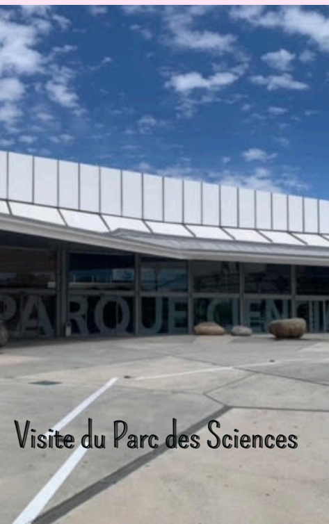
Visite du Parc des Sciences