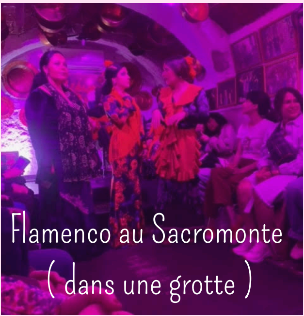
Flamenco au Sacromonte ( dans une grotte )

Slogan du collège cette année "Compte sur moi"