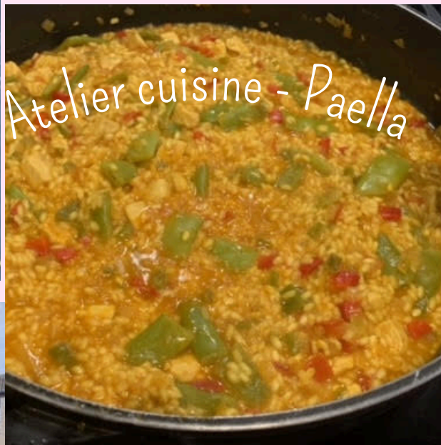
Atelier cuisine - Paella