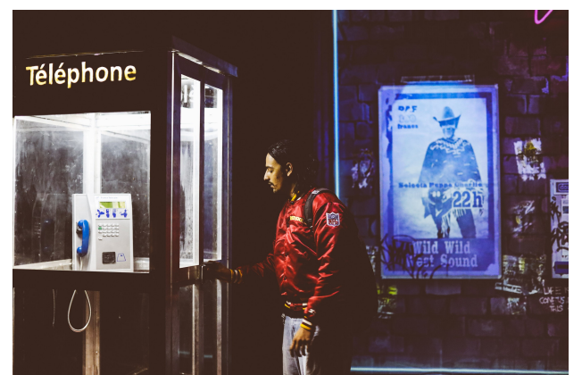
La pluie pleure.