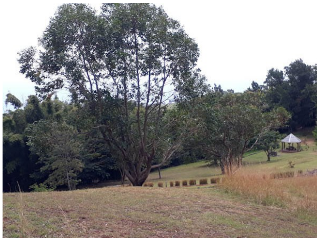
Le domaine Fleurié à La Montagne