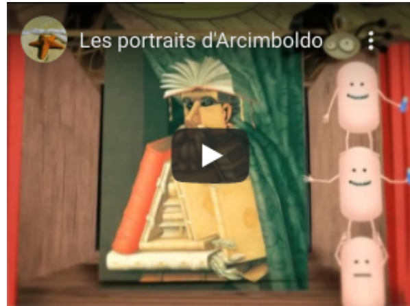
Les portraits d'Arcimboldo https://youtu.be/L8q3qOGGVBg

JE REGARDE DES ŒUVRES ET JE VAIS À LA RENCONTRE DES ARTISTES