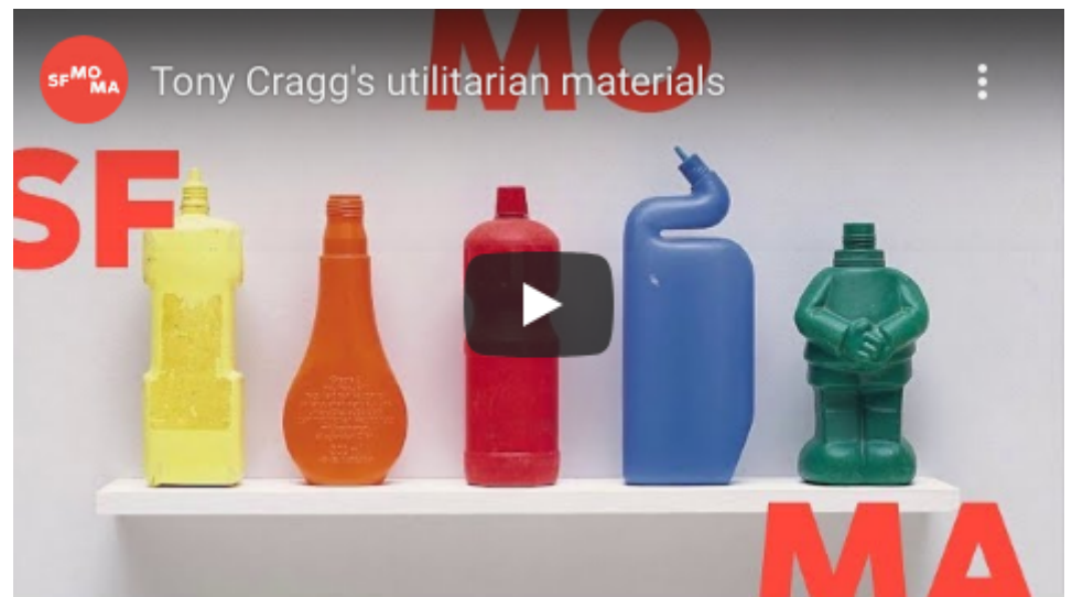
Regardez "Tony Cragg's utilitarian materials" https://youtu.be/kwy7tvUbWgw