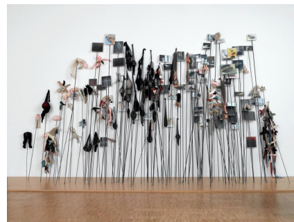
Découvrez Annette MESSAGER et son oeuvre "Les piques" https://www.centrepompidou.fr/cpv/resource/cgrAAX/rbLAokM

et différentes parties qui forment .... un tout, notre cerveau ! https://images.app.goo.gl/2RFS8NnwqeVjhWKpZ