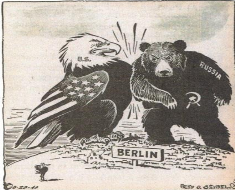
Caricature américaine de Fred O Seibel, 29 juin 1948.