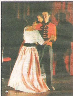
En costumes d'époque.