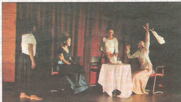
« Racines » est aussi l'histoire de la période anglaise de l'île.