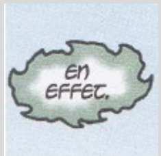
Bulle du Spectre, confirmant sa nature surnaturelle.