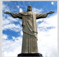
Christ Rédempteur, Rio (Brésil) saisi en contre-plongée

12 disciples choisis par Jésus-Christ afin de propager sa Parole, ses idées.