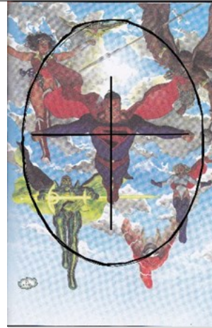
Composition figée, cercle autour d'une croix