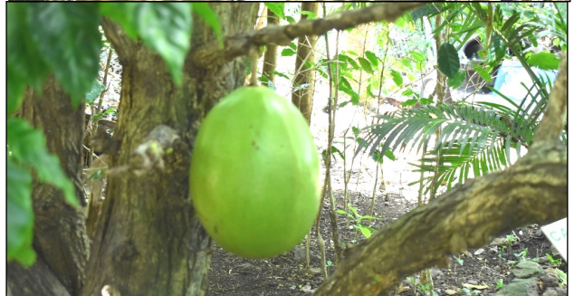
Au début de la visite du jardin, le guide nous montre une calabasse, à partir de laquelle on peut réaliser un instrument de musique : le bobre.