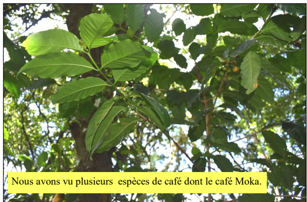
Nous avons vu plusieurs espèces de café dont le café Moka.

Nous avons d'abord exploré le jardin. Nous avons découvert des cultures dédiées au café qui existaient autrefois au Vieux Domaine : nous voyons plusieurs espèces de café dont le café Moka.