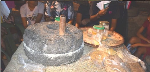
De haut en bas : Les meules qui broient le maïs selon le type de farine souhaité.- Un moulin à maïs - Panneau sur l'histoire de la minoterie .