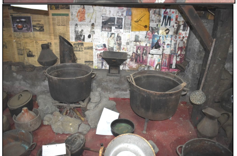
Divers objets de la cuisine d'autrefois.