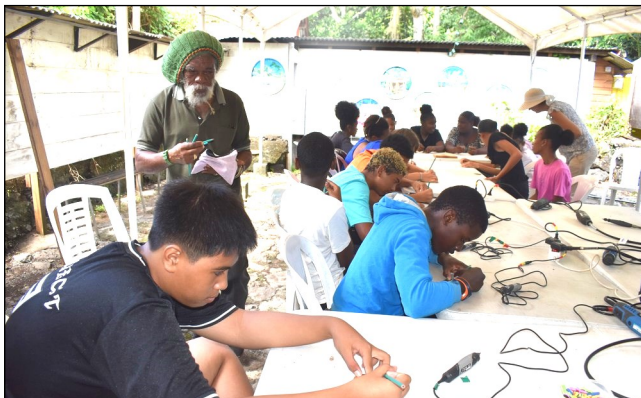
Les élèves et enseignants créent chacun un motif sur un médaillon fait en calabasse. Chacun repart ensuite avec son collier décoré de perles.

D'abord, nous avons fait un atelier pour décorer un médaillon fait en calabasse. Il fallait dessiner un motif dans le morceau de calabasse que nous avons eu ; puis nous l'avons décoré avec des perles pour en faire un collier. Une fois l'atelier de création terminé, nous avons gardé notre collier. Puis nous commençons notre visite guidée.