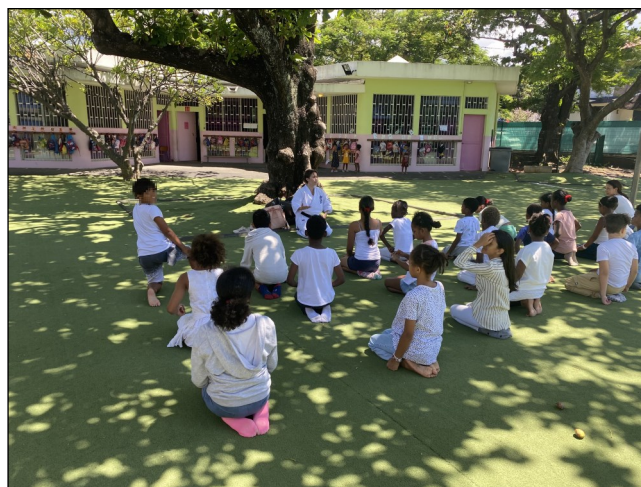
L'école de Bossard a choisi de célébrer la Femme l'après-midi.

Par ailleurs, l'ensemble de la communauté éducative a pu être sensibilisée à l'égalité entre les filles et les garçons ainsi qu'entre les hommes et les femmes. Sur ce thème crucial, le réseau a bénéficié de trois expositions et de la diffusion de films grâce à un partenariat entre le réseau, les acteurs du monde économique, social, éducatif et associatif :