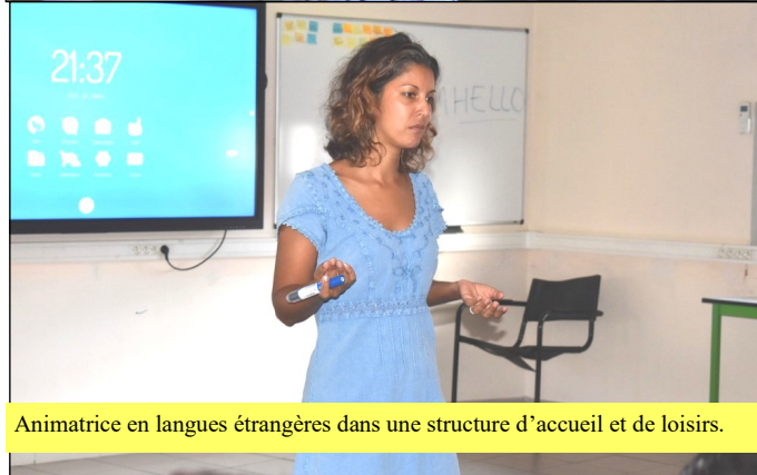
Animatrice en langues étrangères dans une structure d'accueil et de loisirs.