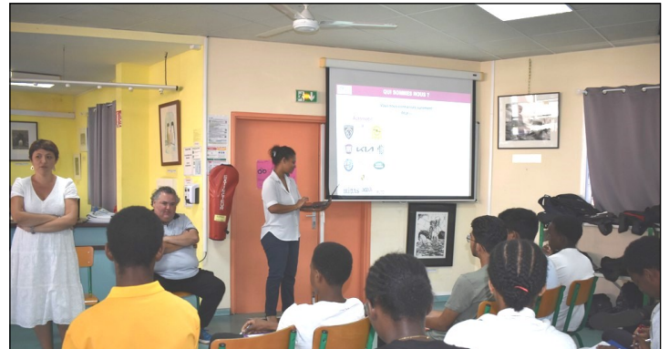
Les intervenantes de l'entreprise d'automobiles Caillé ont présenté un long diaporama sur les différents services et métiers de l'automobile, ce qui n'a pas toujours intéressé les élèves.