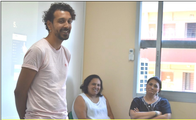
Au premier plan coiffeur, au centre manageuse à la CAF, à droite responsable de projets.