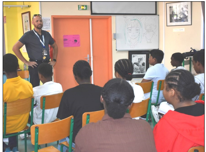
Agent de la Police Nationale.

Le vendredi 1er mars 2024, les élèves des classes de troisième ont eu l'opportunité de rencontrer différents professionnels au collège Élie Wiesel du Chaudron à l'occasion d'un forum des métiers.