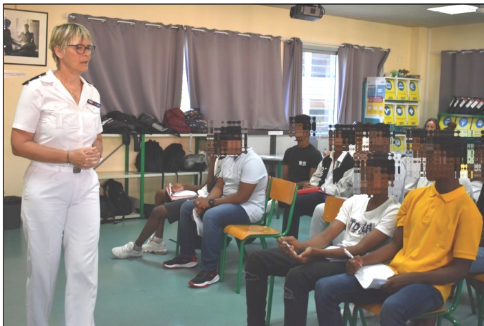
Les métiers présentés au forum : Militaire de la Marine Nationale.