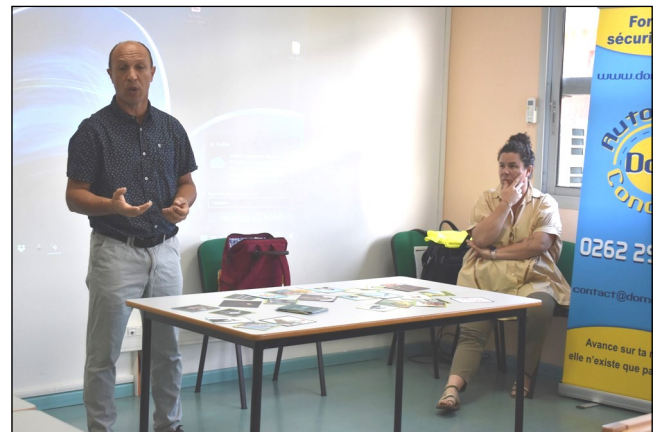
Moniteur d'auto-école et infirmière.

Nous avons eu droit à une présentation de chaque métier comme celui de kinésithérapeute. Nous avons reçu plein d'informations sur ce métier, comme le fait que l'on peut être atteint d'un handicap physique et travailler correctement. L'intervenant nous a parlé des études, du salaire, le fait de travailler en libéral ou travailler au sein d'une entreprise ou même dans les hôpitaux.