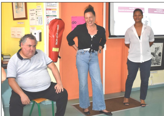
Kinésithérapeute malvoyant, représentantes de l'entreprise automobile Caillé.

(Imane 304) - Collaboration de Mme BOVALO