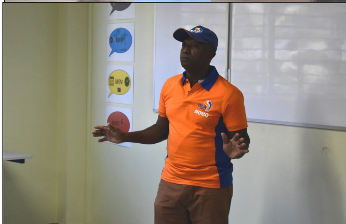
Le discours sur son professionnalisme et la personnalité du pompiste ont captivé les élèves.