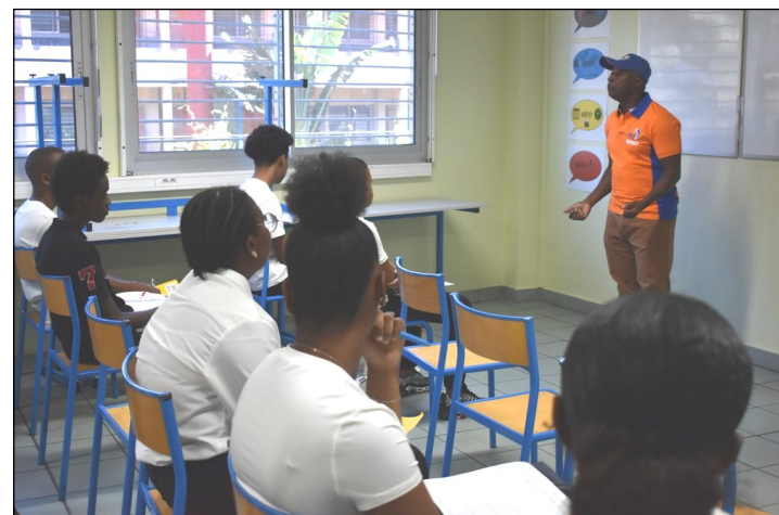
Pompiste passionné par son métier.