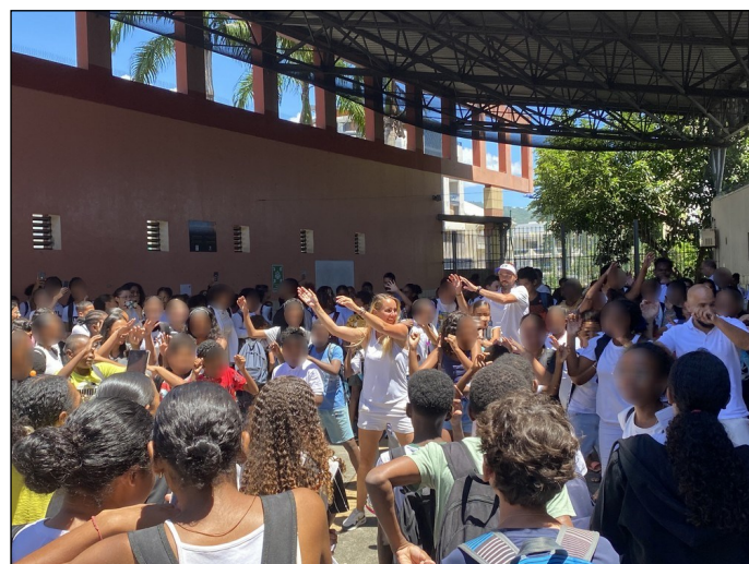
La matinée s'est clôturée en musique avec un flashmob.

La matinée s'est clôturée en musique avec un flashmob entraînant des élèves de 4 ème suivi du chant « Et bam ! Et bam » de Mentissa, interprété par les élèves de 5 ème . L'école de Bossard a choisi de célébrer la Femme l'après-midi. Les intervenants y ont été accueillis sur un slam, « Mesdames » de Grand Corps Malade, clamé par les élèves de CM1 26 de Madame Soobratty.