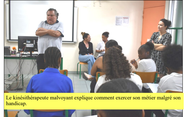
Le kinésithérapeute malvoyant explique comment exercer son métier malgré son handicap.