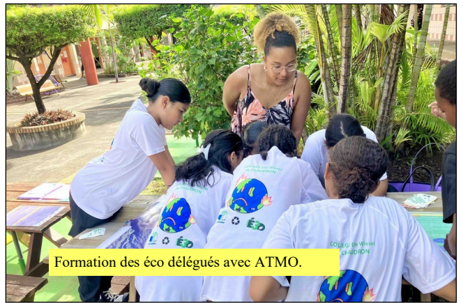
Formation des éco délégués avec ATMO.