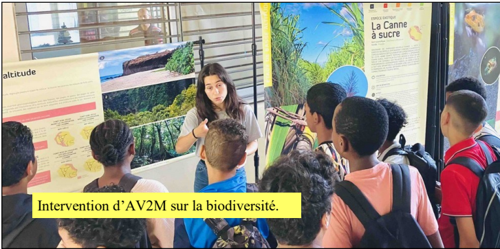
Intervention d'AV2M sur la biodiversité.

Le collège Elie Wiesel du Chaudron organisait, du 11 au 18 décembre 2023, sa troisième SIDD (semaine interdisciplinaire du développement durable), opportunité de prendre le temps de réfléchir ensemble, de sensibiliser les élèves, de leur faire prendre conscience d'enjeux importants pour l'avenir.