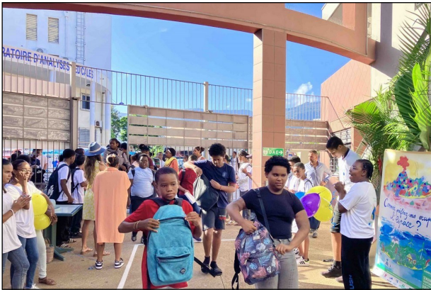
Accueil des élèves par les éco délégués.