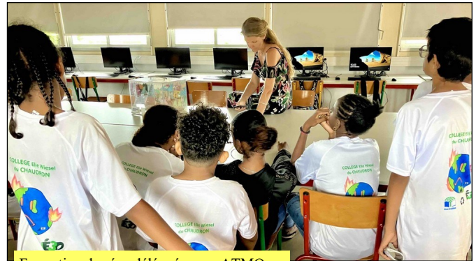
Formation des éco délégués avec ATMO.