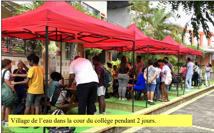
Village de l'eau dans la cour du collège pendant 2 jours.

Le collège Elie Wiesel du Chaudron organisait, du 11 au 18 décembre 2023, sa troisième SIDD (semaine interdisciplinaire du développement durable), opportunité de prendre le temps de réfléchir ensemble, de sensibiliser les élèves, de leur faire prendre conscience d'enjeux importants pour l'avenir.