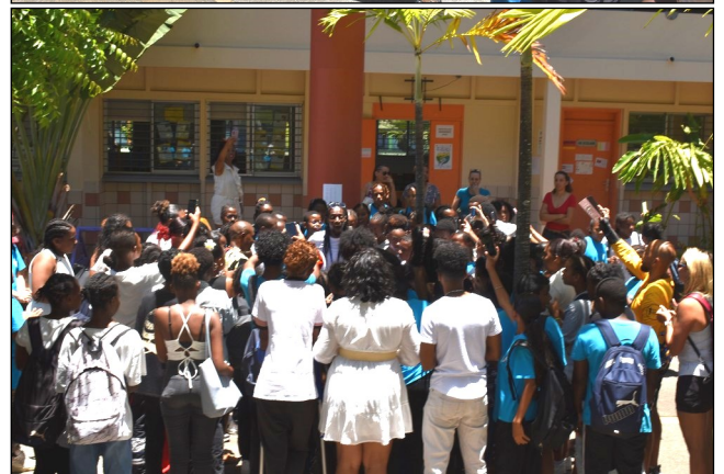
Nono a mis l'ambiance et a fait chanter et danser les élèves du collège.