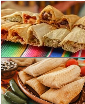
Tamales : Pâte de maïs farcie et cuite dans une feuille .