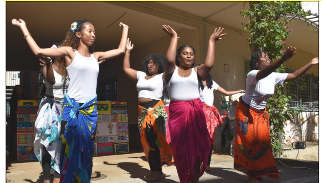
Des élèves des Cordées de la Réussite ont dansé avec grâce sur la chanson Lakalaka .