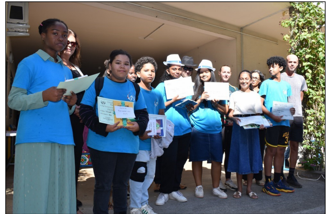
Remise des prix des élèves de 5eme.