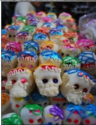
Calaveras de azúcar : Petits crânes en sucre colorés.