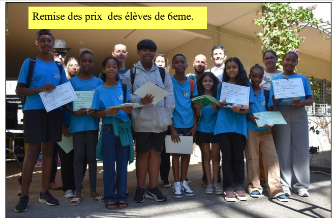
Remise des prix des élèves de 6eme.