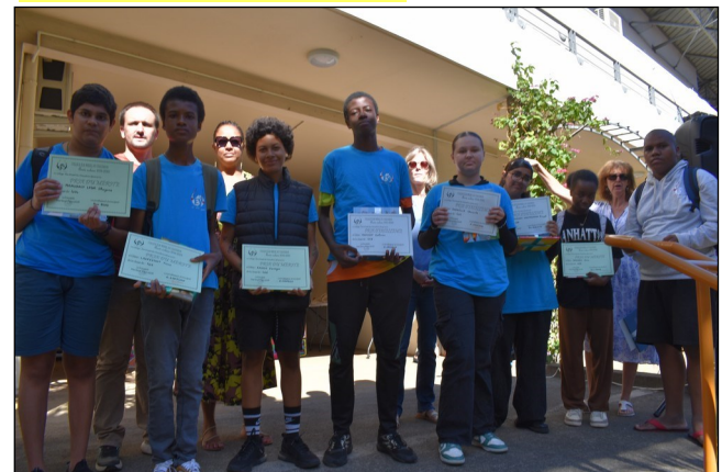
Remise des prix des élèves de 4eme.