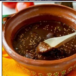
Mole : Sauce mexicaine célèbre, servie avec du poulet.