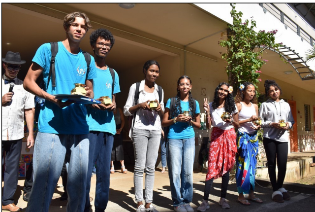
Remise des prix des Chaudrons d'or (Félicitations de la 6eme à la 3eme) aux élèves de 3eme.