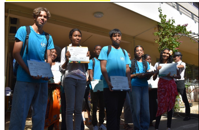
Remise des prix des élèves de 3eme.