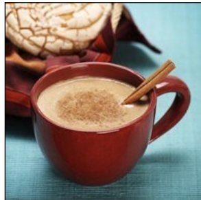
Champurrado et Atole : Boissons chaudes et épaisses à base de maïs .