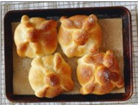
Pan de muerto : Pain sucré traditionnel décoré avec des formes d'os.