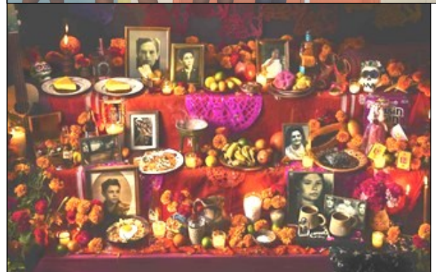
Fruits et plat préféré du défunt : Oranges, bananes, goyaves, pour apporter couleur et douceur. Chaque famille prépare le plat que la personne aimait.