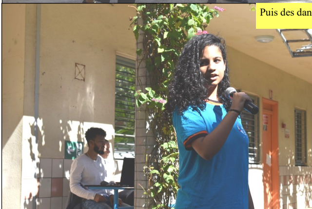
Puis des danses et chants se succèdent.