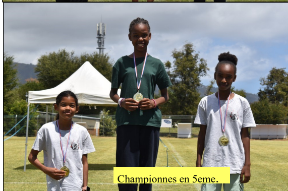
Championnes en 5eme.