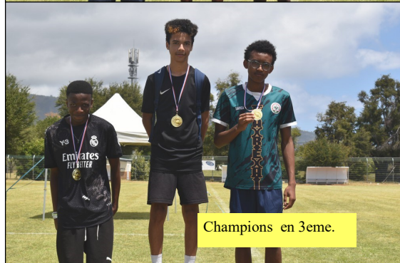
Champions en 3eme.