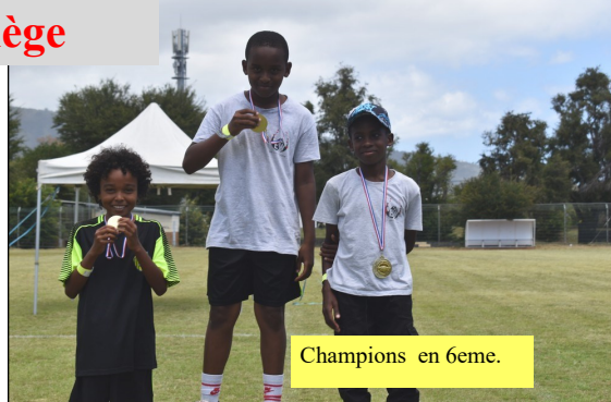
Champions en 6eme.