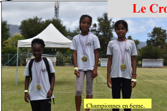
Championnes en 6eme.