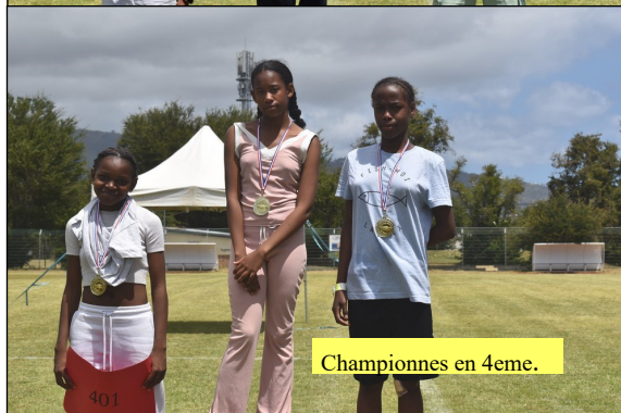
Championnes en 4eme.