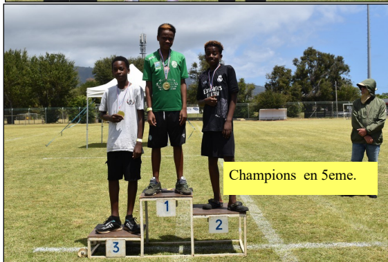
Champions en 5eme.