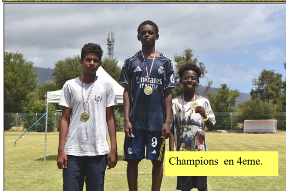
Champions en 4eme.