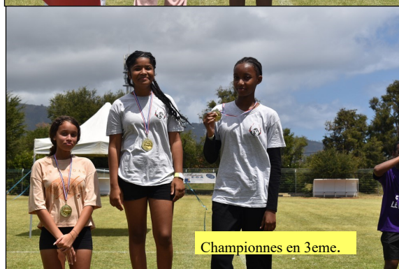
Championnes en 3eme.