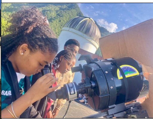
Les élèves ont visité l'observatoire des Makes et ont pu apprendre davantage sur l'astronomie, l'observation du ciel, des étoiles et du soleil.