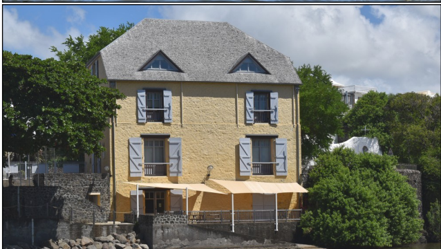
Ce bâtiment est un ancien entrepôt de café, que l'on peut voir plus haut sur les peintures représentées ci-contre.