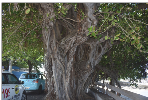
Dans chaque rue, des banians immenses aux racines infinies (arbre sacré originaire de l'Inde).