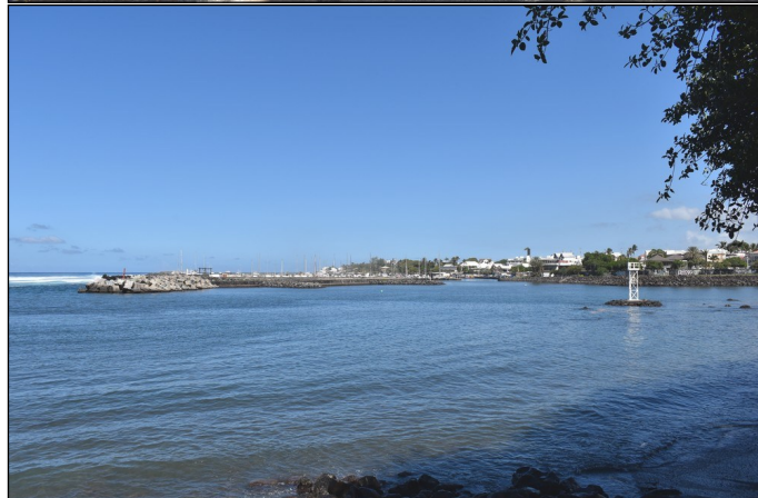
Ci-dessus : en arrière-plan de l'ancre, la jetée de Terre Sainte - au centre : au loin le littoral de Saint-Pierre - nous commençons notre randonnée historique en empruntant les ruelles étroites et pittoresques du quartier de Terre Sainte.