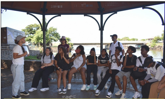
Notre guide nous donne des précisions historiques sur le site de la Rivière d'Abord, premier port de Saint-Pierre ; elle nous montre des illustrations représentant cette époque.