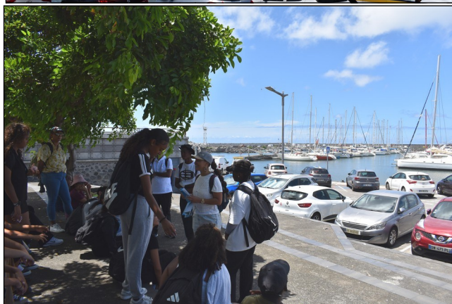
Arrivée au Port de plaisance de Saint-Pierre, inauguré en 1883 mais qui n'a pu concurrencer le port de la Rivière des Galet ouvert en 1886.