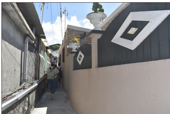
Terre Sainte, un quartier authentique et maritime aux ruelles étroites, dont les murs sont embellis d'œuvres street art, dont les gouzous de Jace.