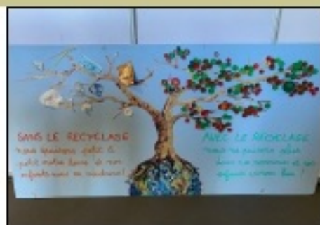
Un bel arbre du développement durable réalisé par un lycée de l'île