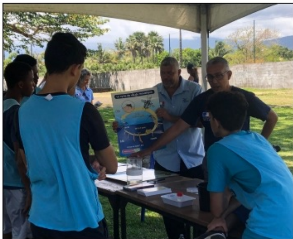
Les élèves en groupes pendant les ateliers

Sur place, il y avait des activités sur le développement durable, sur lutte contre la leptospirose et la dengue (ARS).