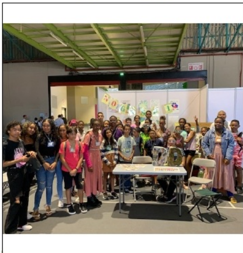
Prêts et motivés pour rencontrer les éco-délégués de l'île et découvrir leurs actions.

Le jeudi 10 novembre, les éco-délégués de cette année et certains de l'année dernière sont allés au Parc des Expositions de Sainte-Clotilde pour présenter nos projets réalisés et à venir.