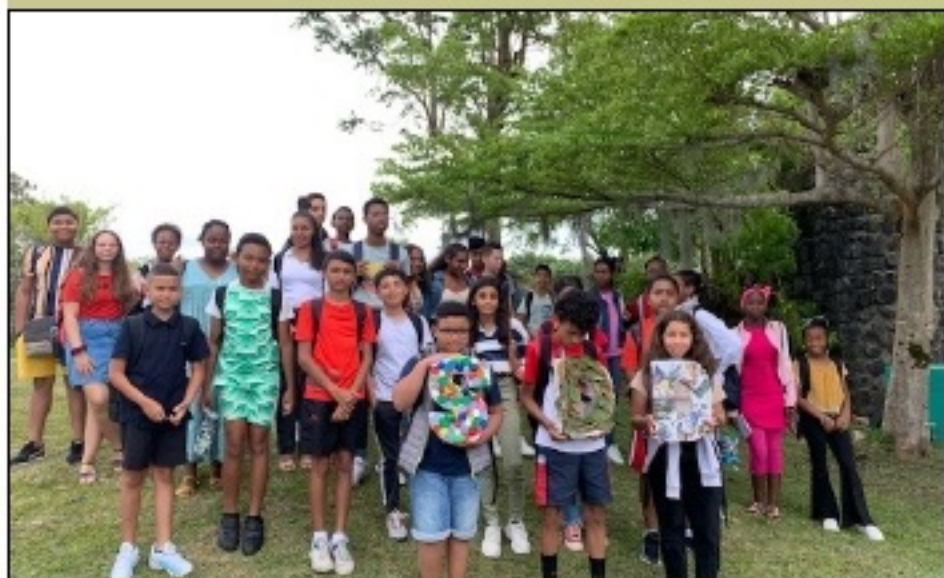
Tous réunis au sentier botanique du collège.

Plein d'idées ont été données comme ouvrir un potager accessible à tous les élèves, avoir moins de déchets dans la cour ou encore obtenir un bac à compost.