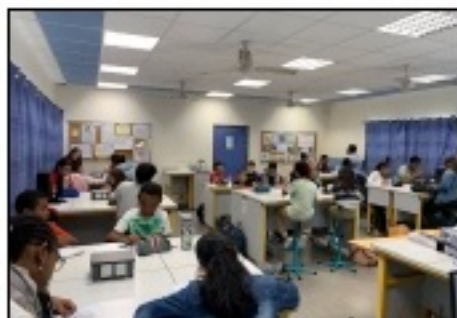
Au travail : présentation et questionnement.

Dès le début de l'année, les éco-délégués ont commencé à travailler sur le développement durable.