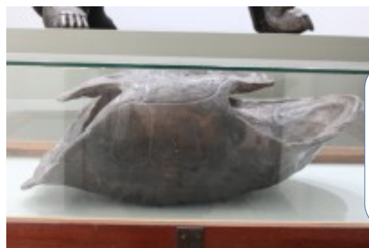
Tortue géante de Bourbon (espèce éteinte) Moulage réalisé à partir du spécimen conservé au Muséum de Paris complété d'un plastron trouvé dans les marais de L'Ermitage les bains.