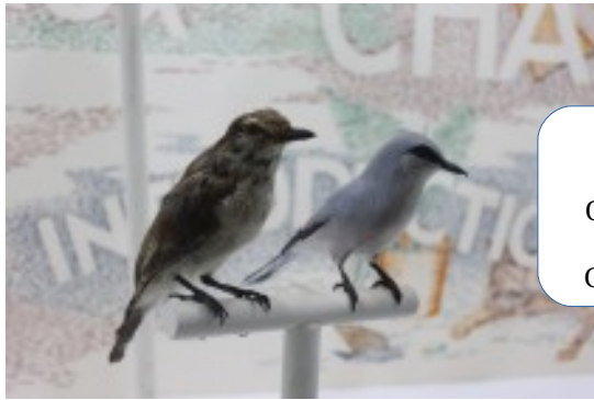
Tuit-tuit (espèce endémique) On évalue sa population à 120-150 couples. Cette espèce est protégée.

Ce dernier espace présente également des espèces vulnérables comme le Tuit-tuit dont on ne compte plus que quelques couples qui tous nichent dans la forêt de la Roche Écrite.