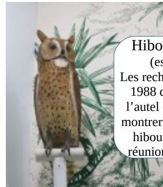
Hibou de Gruchet (espèce éteinte) Les recherches menées en 1988 dans la grotte de l'autel (St Gilles) ont pu montrer la présence de ce hibou dans l'avifaune réunionnaise originelle.