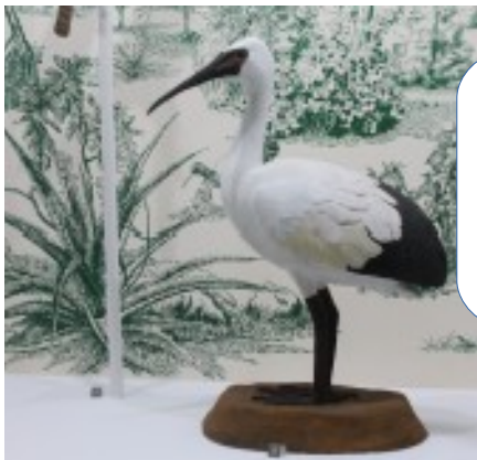
Solitaire de La Réunion (espèce éteinte) Ibis endémique disparu, identifié en 1995, des Ossements ont été découverts lors de fouilles dans des grottes et le marais de l'Ermitage.