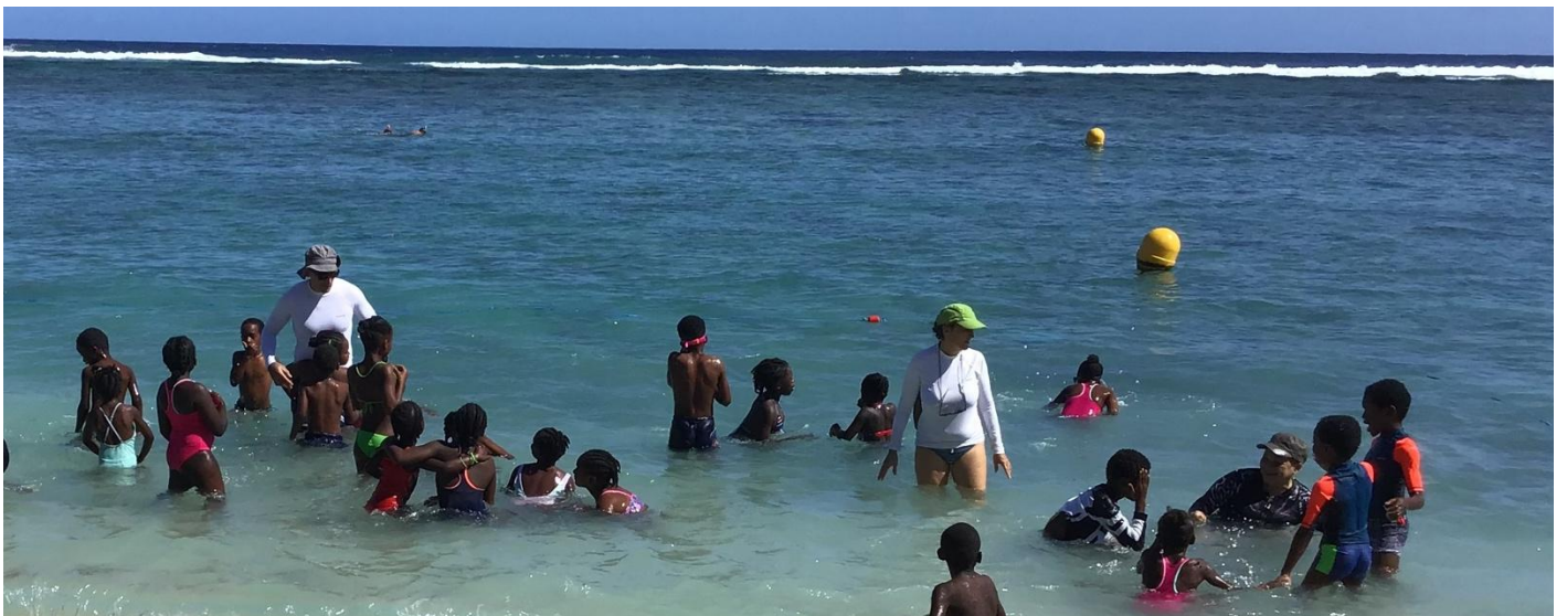
Natation dans le lagon