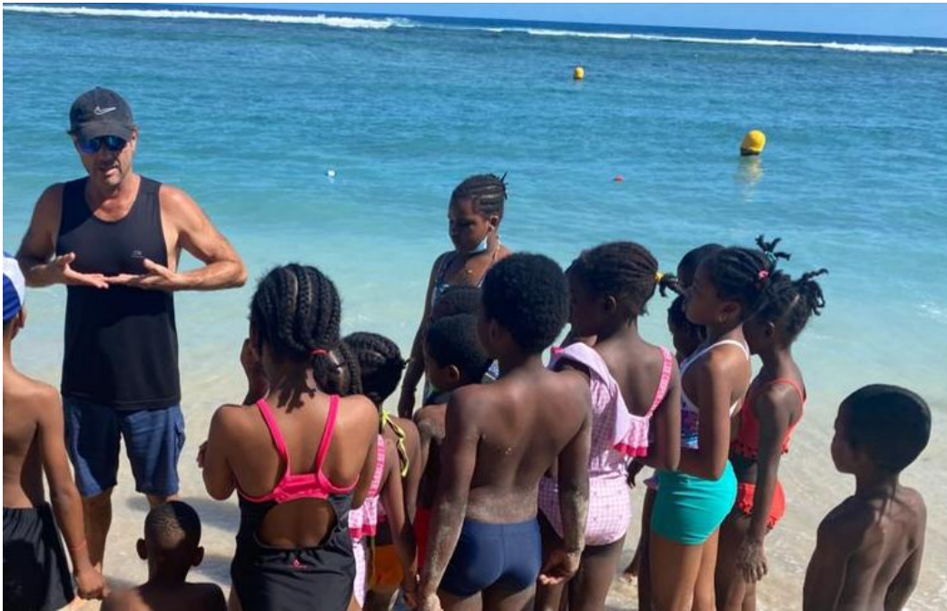
Consignes de sécurité par le maître-nageur