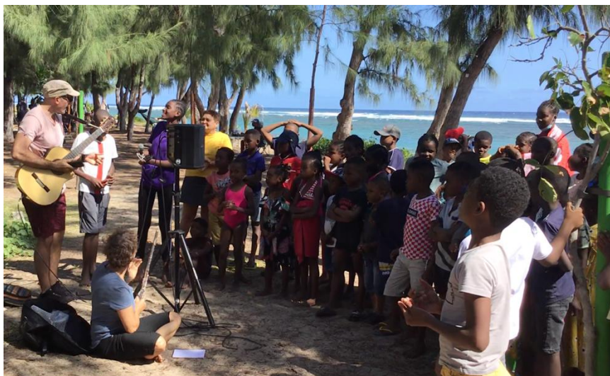
Les élèves chantent Santiano