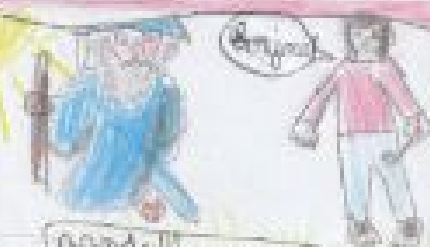
Gandalf le blanc