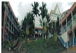
COLLEGE DE LA MONTAGNE