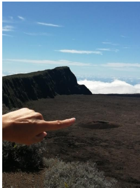
Volcano: Piton de Fournaise

El jueves , visitamos Boucan Canot, que es una playa agreste, donde no se puede nadar porque hay tiburones, y luego el Museo Kelonia de las Tortugas Verdes, en Saint LEU, donde hay tambien, un centro de recuperación y conservación de las mismas.