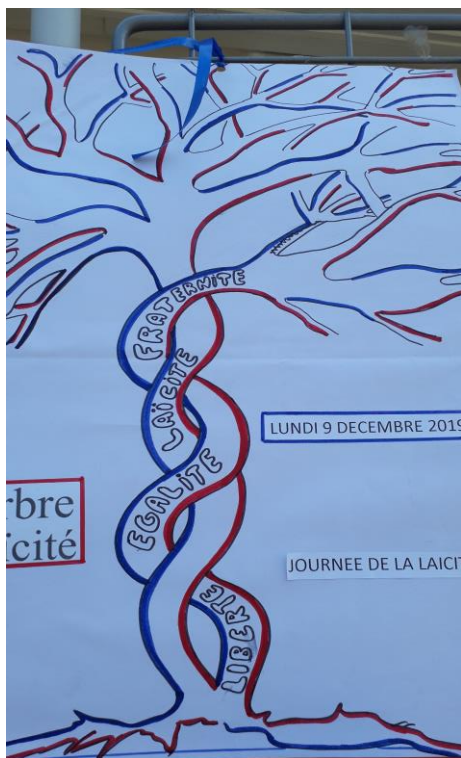
← de magnifiques réalisations de Michèle Ethève des AED