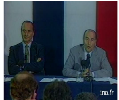
1 ère cohabitation, 1986-1988.