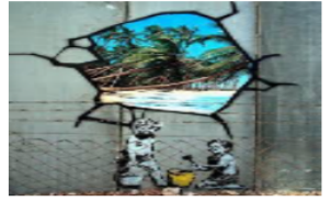
Santa's Ghetto de Banksy.