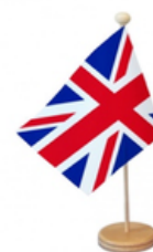
Drapeau de l'Union Jack.