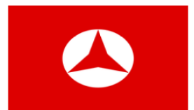
Symbole de cette coalition. Bog.univ-angers.fr