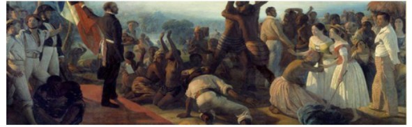
Abolition de l'esclavage, de François Biard.