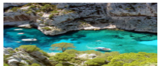
Laciotat.over-blog.fr ; calanques dans la Mer Méditerranée.