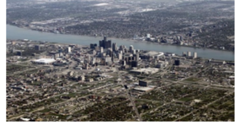
Détroit, une ville quasi déserte.