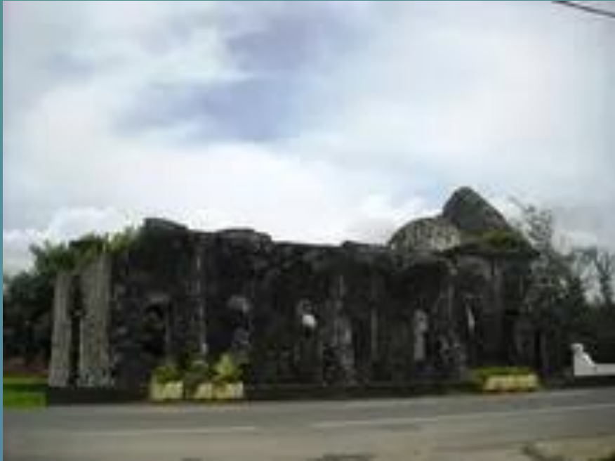
photo prise sur la route de la Montagne

L'église de Champ Borne, les paillottes et les petites cases voisines, sont balayées par le raz-de-marée survenu lors du cyclone Jenny.