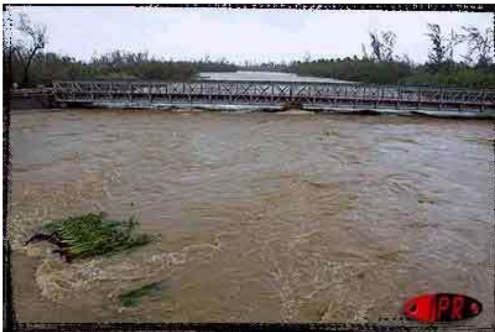
Route de Salazie