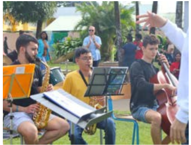
L'orchestre sans frontière.