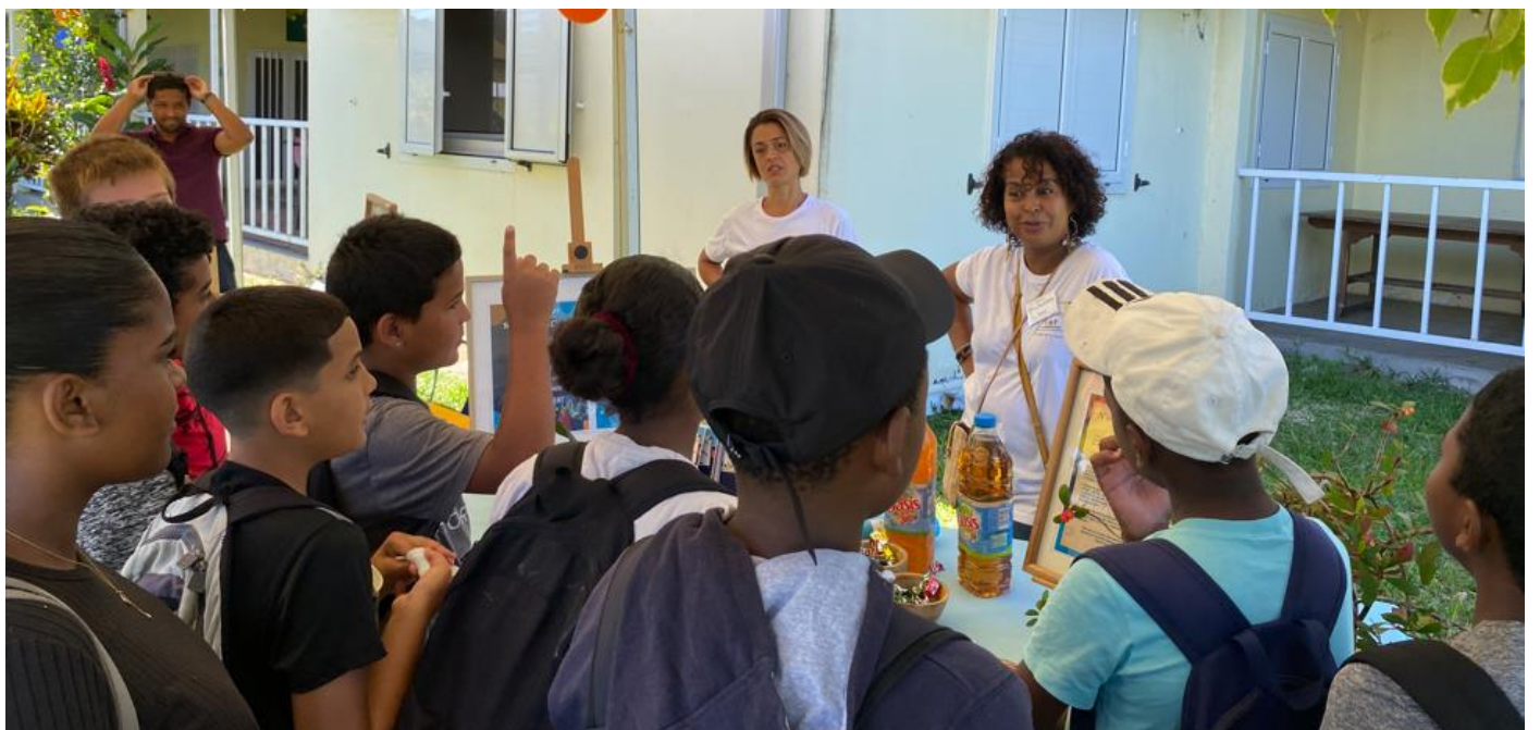
L'atelier des aidants -familiaux des questions qui fusent !