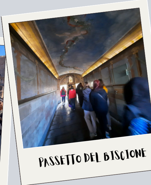
PASSETTO DEL BISCIONE

Quelques photos, souvenirs du magnifique voyage à Rome ! Grâce à Erasmus, les élèves ont découvert de nouveaux amis, un nouveau pays, une nouvelle langue et surtout les belles photos des livres in situ !