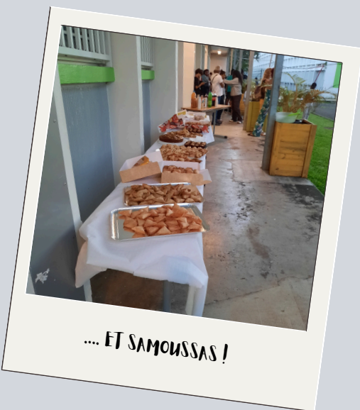
.... ET SAMOUSSAS !