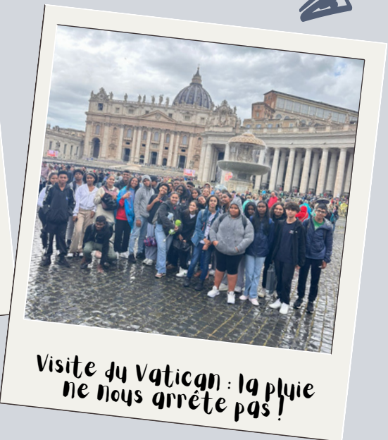
Visite du Vatican : la pluie ne nous arrête pas !