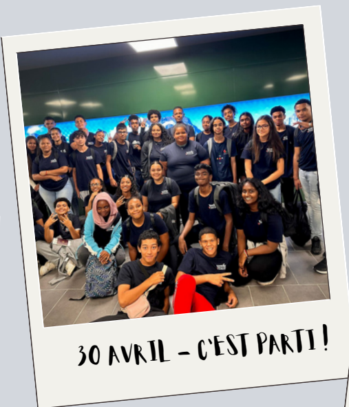
30 AVRIL - C'EST PARTI !