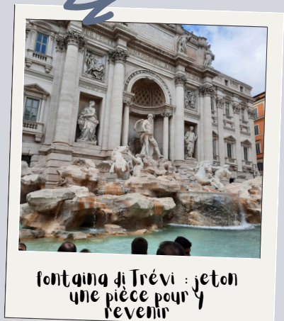
fontaine di Trévi : j'eton une pièce pour y revenir