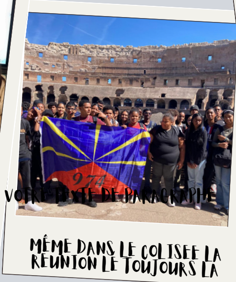
VOIR LE SITE DE PARAGRAPHIE MÊME DANS LE COLISEE LA RÉUNION LE TOUJOURS LA