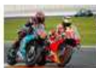
les champions de moto GP