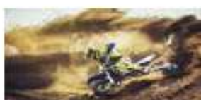
le champion de moto De sable