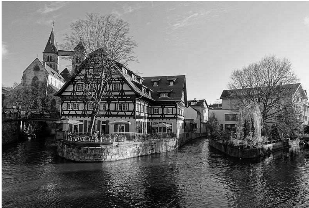
Esslingen am Neckar, Allemagne du Sud