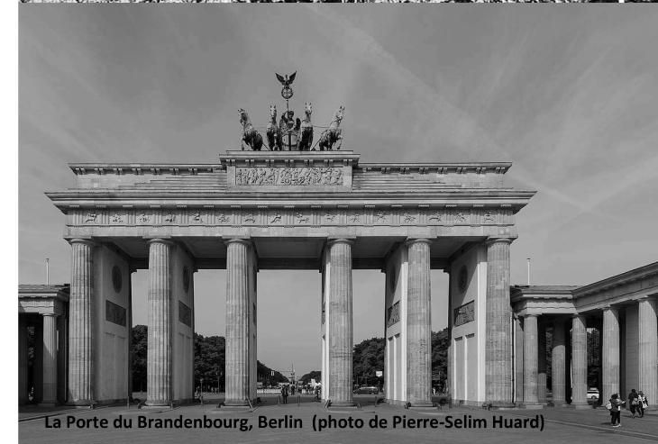
La Porte du Brandebourg, Berlin