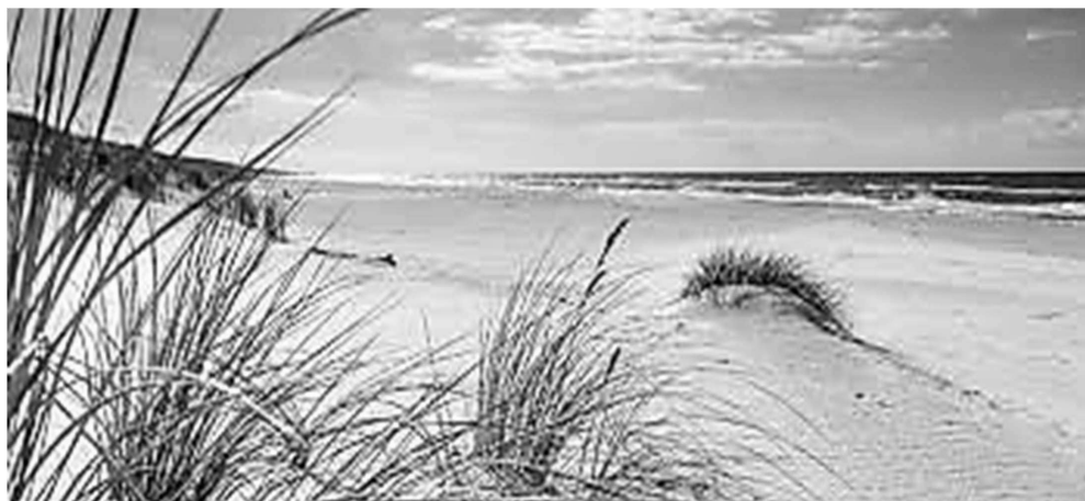
La plage dans le nord de l'Allemagne

...le fait d'apprendre l'allemand est favorable à l'acquisition d'autres langues étrangères. Par sa différence par rapport au français, il permet au cerveau de s'ouvrir à des fonctionnements linguistiques différents. Il est donc conseillé de choisir l'allemand pour donner un entraînement idéal au cerveau de votre enfant et les méthodes d'aujourd'hui aident à apprendre cette langue plus facilement qu'autrefois !