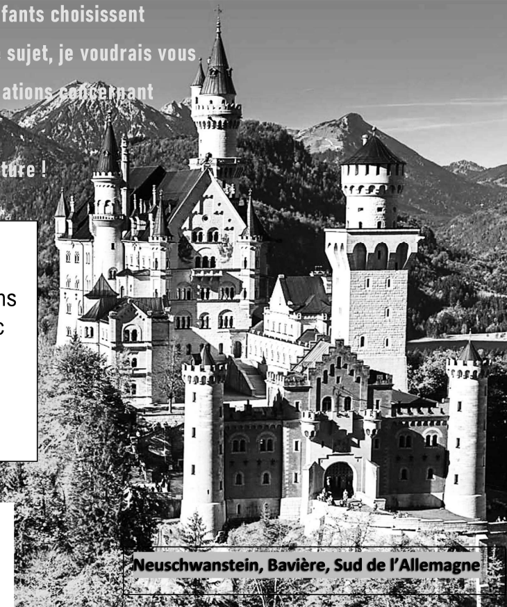
Neuschwanstein, Bavière, Sud de l'Allemagne