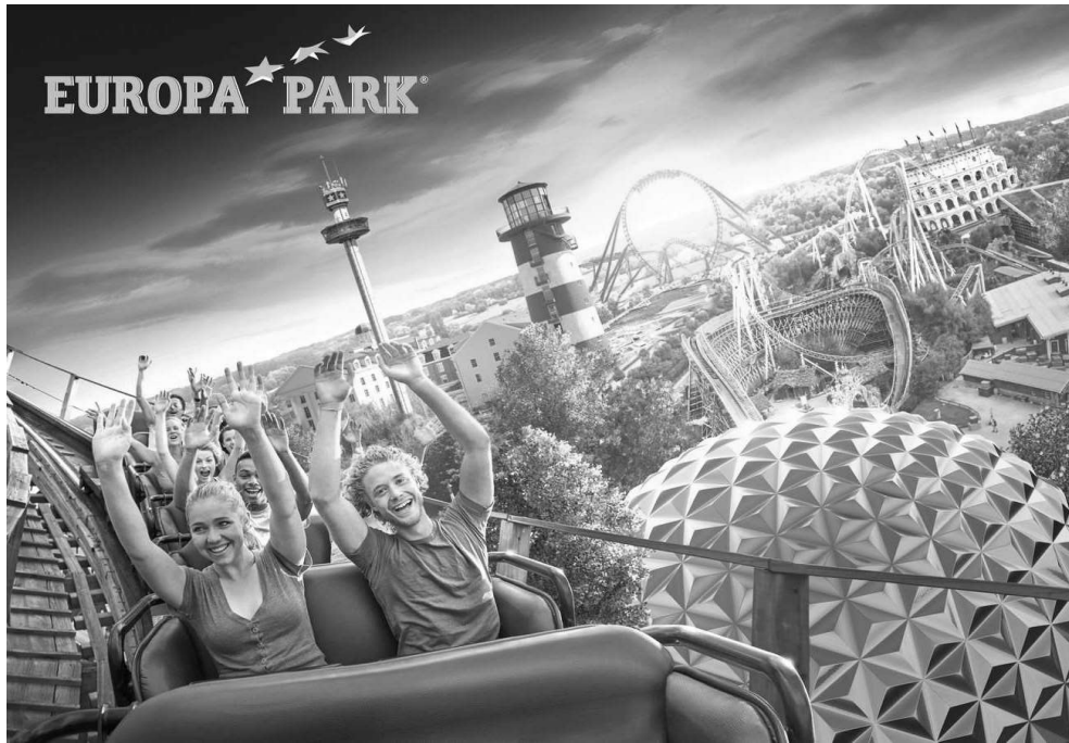
Europapark a été élu meilleur parc d'attraction du monde et se trouve près de Strasbourg sur le côté allemand.