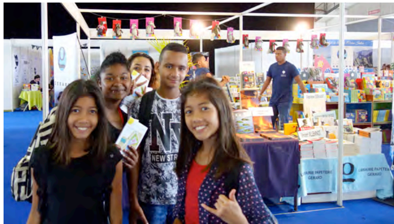
Un bon souvenir pour l'ensemble des collégiens de Trois Bassins

Visite libre pour les élèves de 5 e 3 de Mme ROMNEY et les élèves ULIS de M. GRADEL.