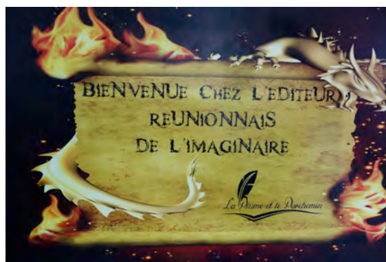
A la découverte des professionnels des arts