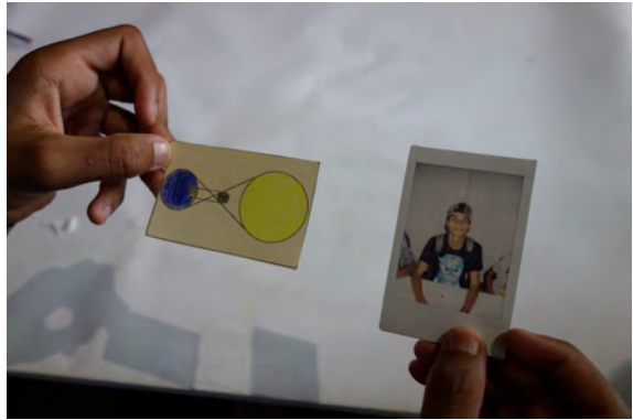
Les élèves de 3 e 1 de Mme VERNADET ont suivi un atelier d'illustration

Visite libre pour les élèves de 5 e 3 de Mme ROMNEY et les élèves ULIS de M. GRADEL.