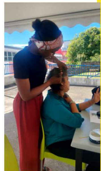
Atelier tressage de cheveux