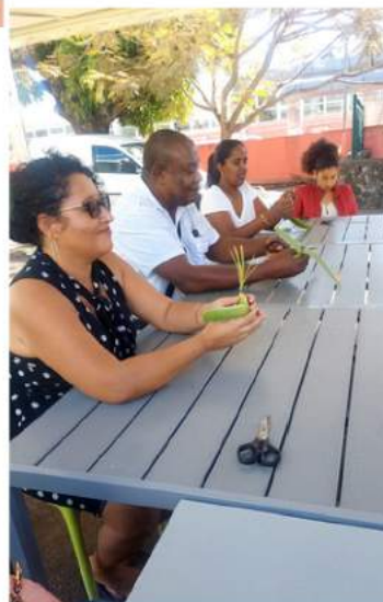
Atelier tressage coco