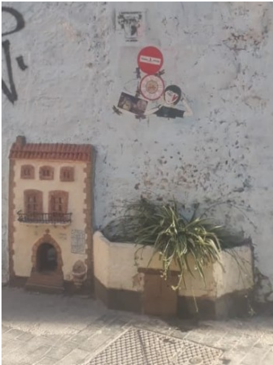
Un artiste de street art fabrique des minis maisons pour les chats ;-)