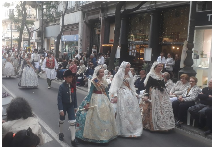
Les habits traditionnels des falleras et falleros sont de sortie pour la célébration du centenaire du couronnement de la protectrice de la ville : la Madre de Deu ou Virgen de los Desamparados .