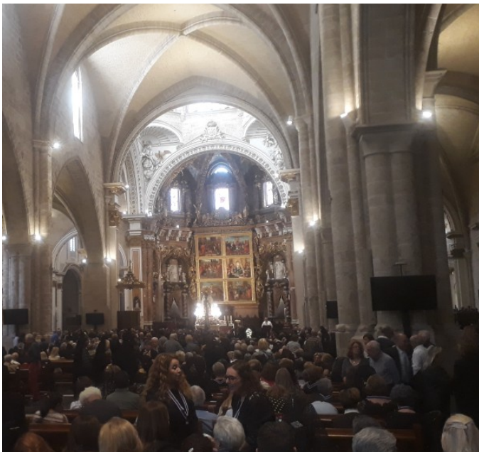
Préparation de la procession de la Madre de Deu dans la cathédrale de Valence, pleine à craquer.

Procession de la patronne de la communauté Valencienne. Portée à la force des bras. La ferveur est bien présente, ainsi que la diversité du public tant au niveau culturel, social que générationnel.