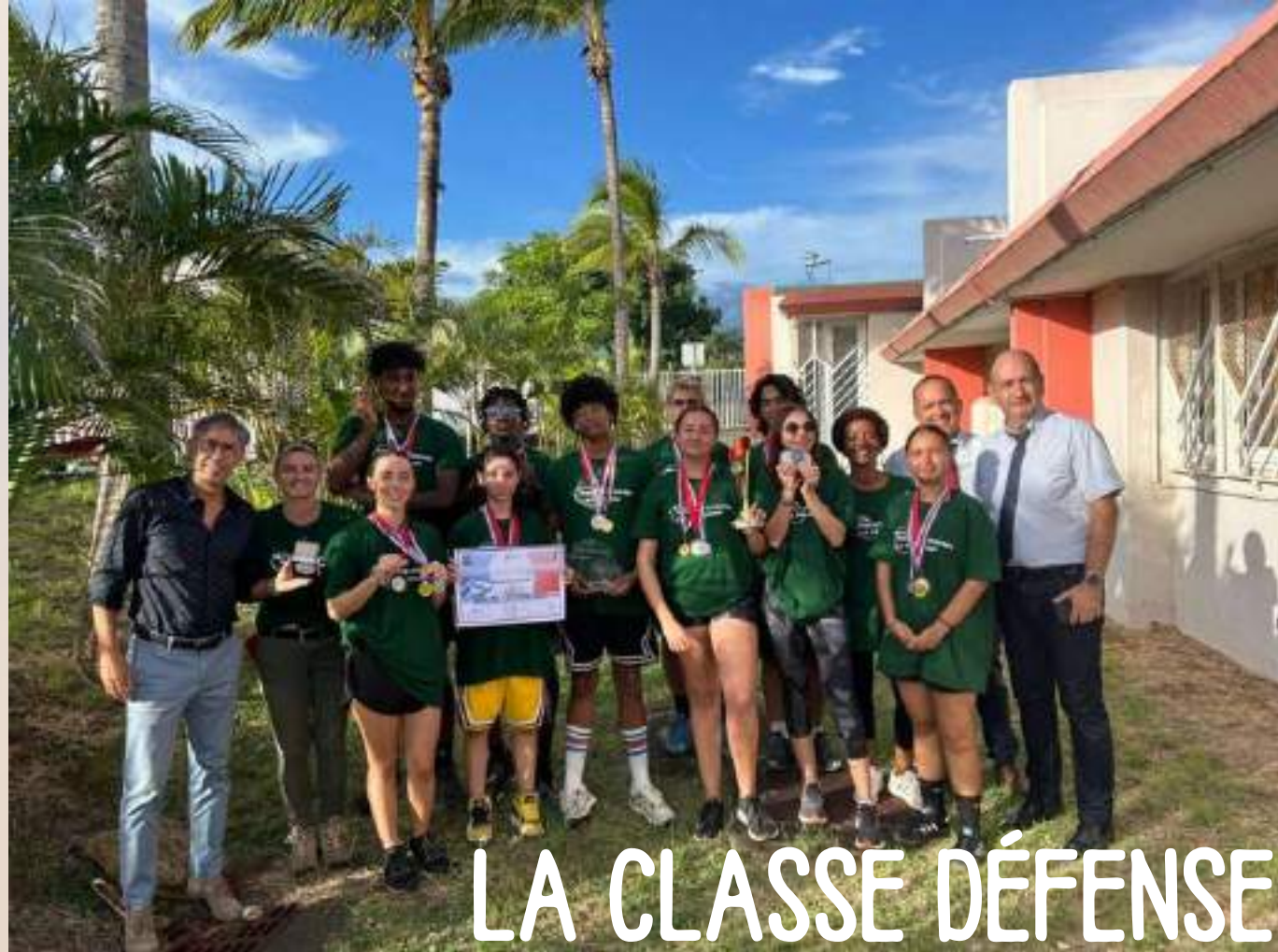
LA CLASSE DÉFENSE

Le lycée Ambroise Vollard est très actif et met en place chaque année une multitude d'activités et de projets pour le bien être et l'accompagnement des élèves.