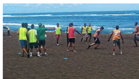
Beach Rugby p.6