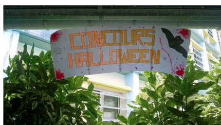
Happy Halloween ! p.4