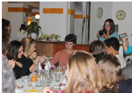
Anniversaire du petit Castillon de 1m93 hihihhi