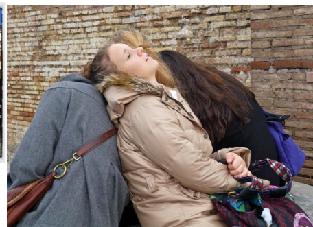
Visite passionnante... toutefois la fatigue se fait sentir !