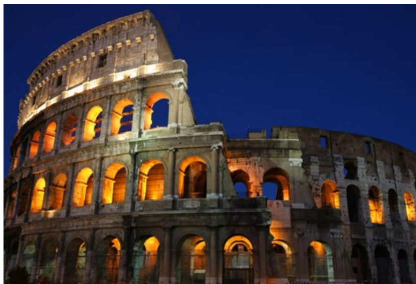
Le Colisée vu la nuit... Magnifique monument !