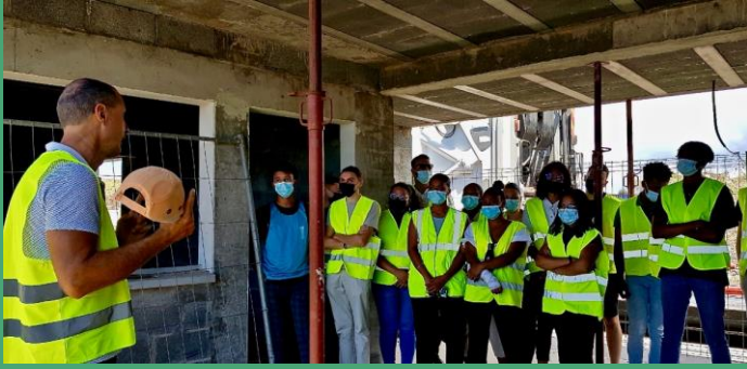
Visites de chantiers