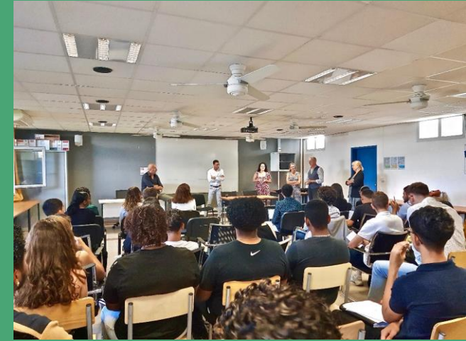
Intervention d'une architecte