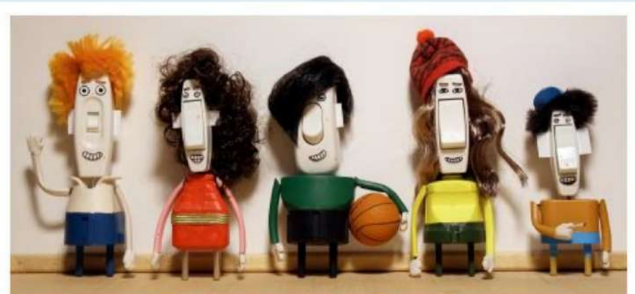
LES LIAISONS FOIREUSES COURT-MÉTRAGE D'ANIMATION DE CHLOÉ ALLIEZ & VIOLETTE DELVOYE ZOROBABEL — VIVEMENT LUNDI!

Pour le mois de l'amour l'association Unis-Cité, nous présente deux courts-métrages. Les liaisons foireuses qui suit l'histoire d'une bande de jeunes en soirée, jouant au jeu de la bouteille. Parmi eux, Maya et Lucy se découvrent des sentiments inattendue l'une pour l'autre.