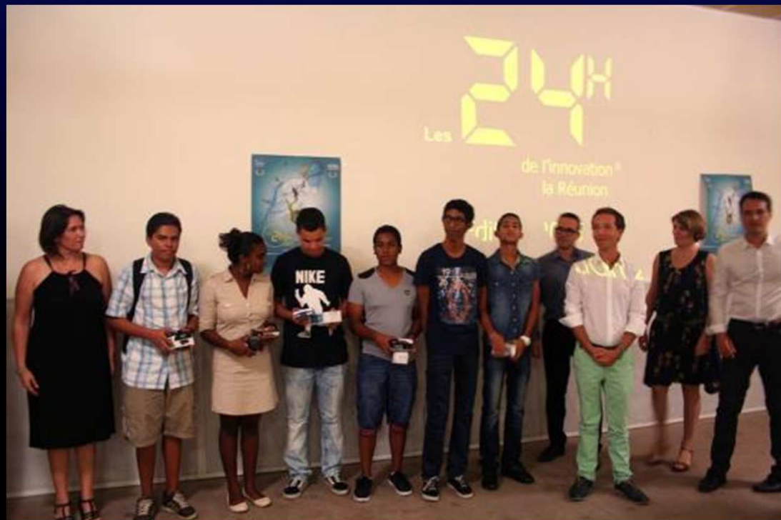
Equipe « les franssois » : 3 ème à la finale au lycée Lislet Geoffroy