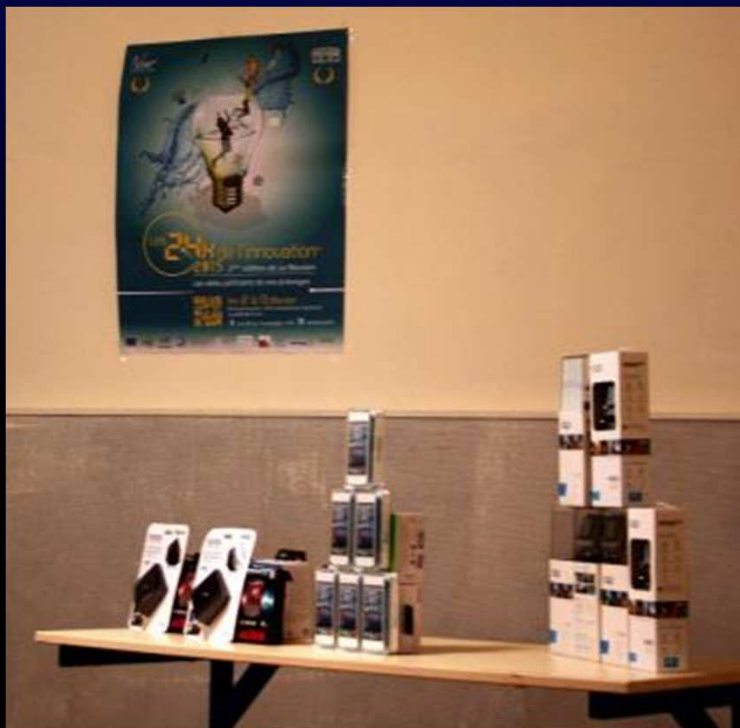
Lots distribués aux 3 équipes finalistes

Les gagnants de la Réunion par équipe sous forme de lots : Tablettes, bons d'achat, etc