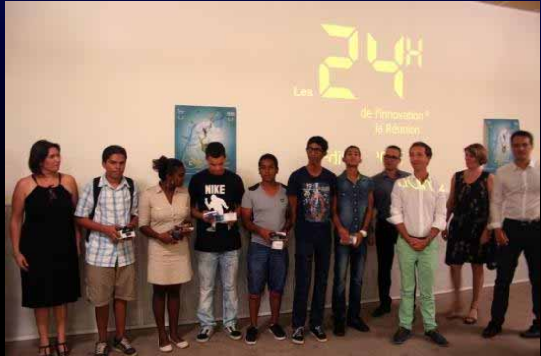
Equipe « les Franssois » : 3 ème à la finale au lycée Lislet Geoffroy - 2015