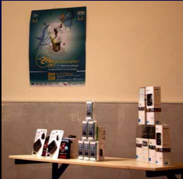
Lots distribués aux 3 équipes finalistes

Les gagnants de la Réunion par équipe sous forme de lots : Tablettes, I-phone, bons d'achat, etc