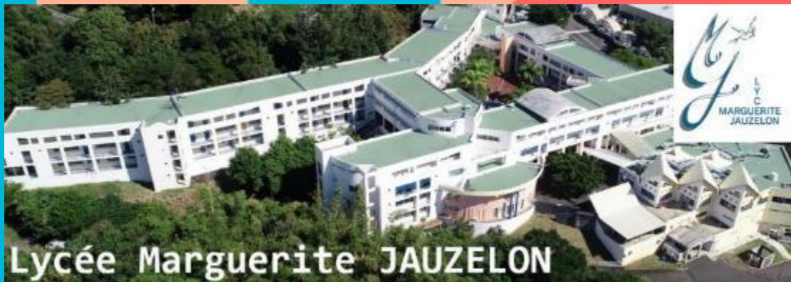
Lycée Marguerite JAUZELON