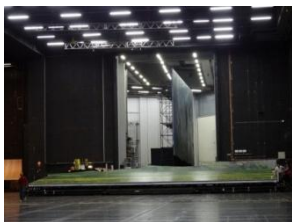
La scène et l'arrière-scène de l'Opéra Bastille