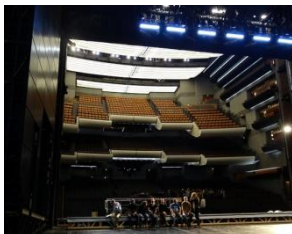
La salle vue de la scène