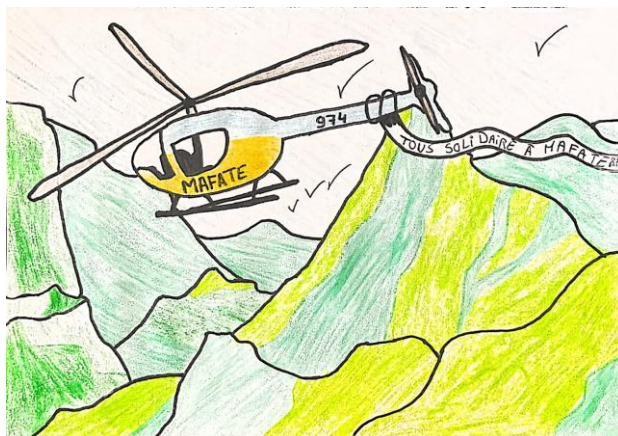
Illustration réalisée par un élève de la 1STI2D1

Des bénévoles se sont portés volontaires pour arpenter les sentiers de randonnées avec sur le dos, des sacs de riz, des pâtes, ou encore des médicaments