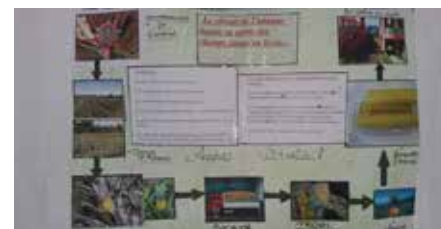
Exemple d'affiches réalisés par les cap ECMS