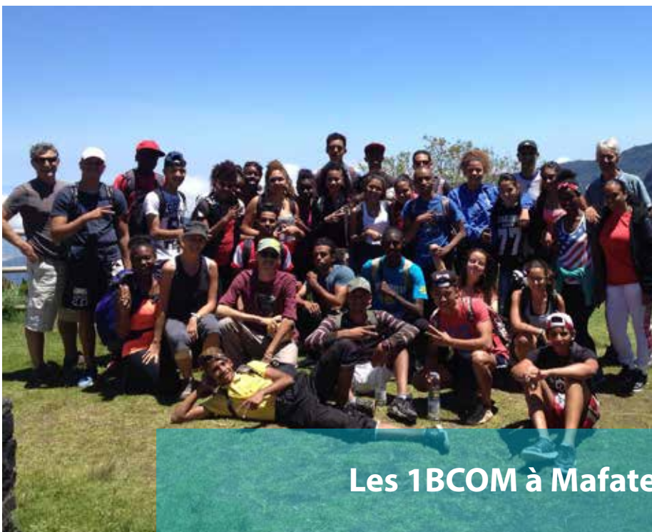
Les 1BCOM à Mafate