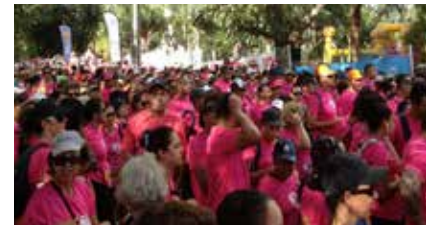
La classe de 2 BARC

Un grand merci à toute l'équipe du lycée qui nous a permis de vivre ce bon moment de partage et de convivialité.