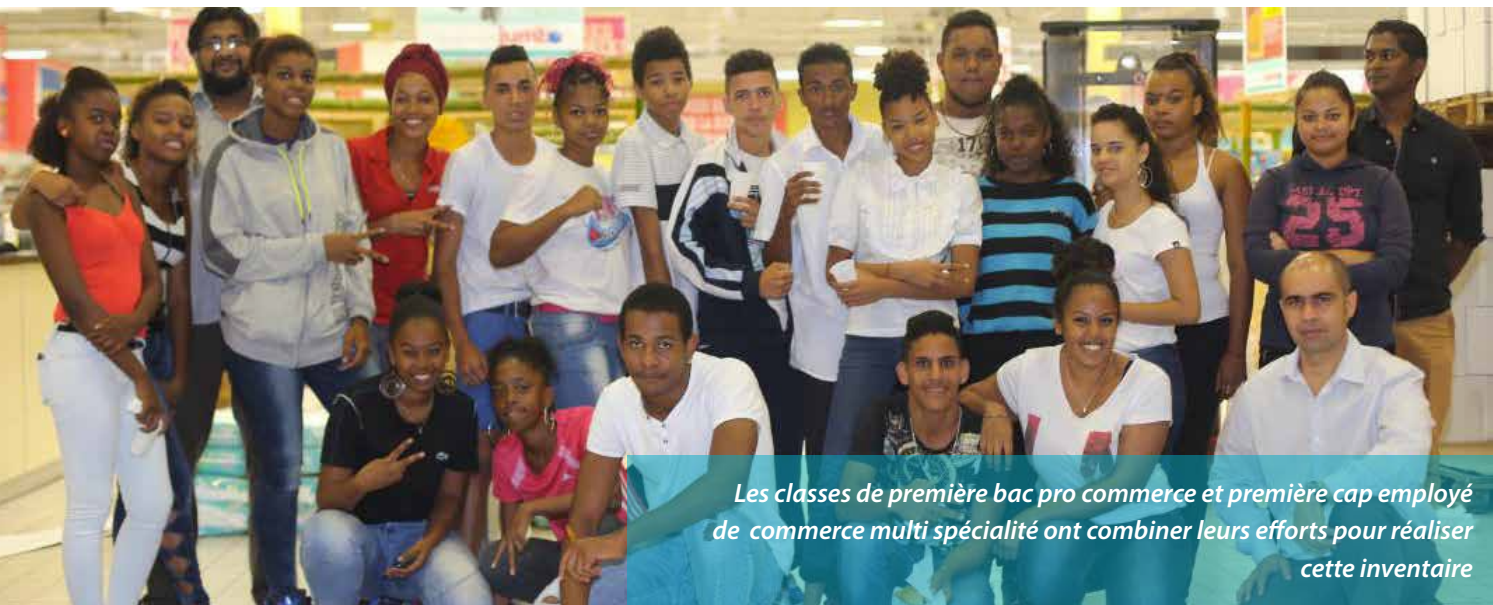
Les classes de première bac pro commerce et première cap employé de commerce multi spécialité ont combiné leurs efforts pour réaliser cette inventaire

L e lundi 21 septembre, les élèves de la IBCOM et des sections ECMS ont participé à l'inventaire général de l'hypermarché Jumbo Score de Sainte Marie. Ils étaient au total 54 inventaristes. Quatre professeurs ont encadré et supervisé le travail des élèves sur site.