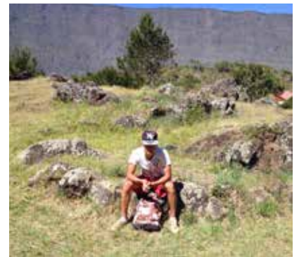
Une remontée parfois éprouvante