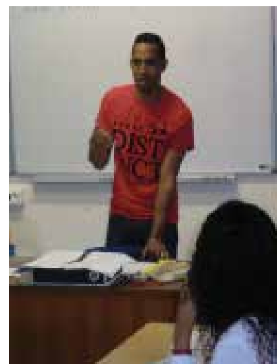
Un ancien élève explique son parcours aux nouveaux entrants