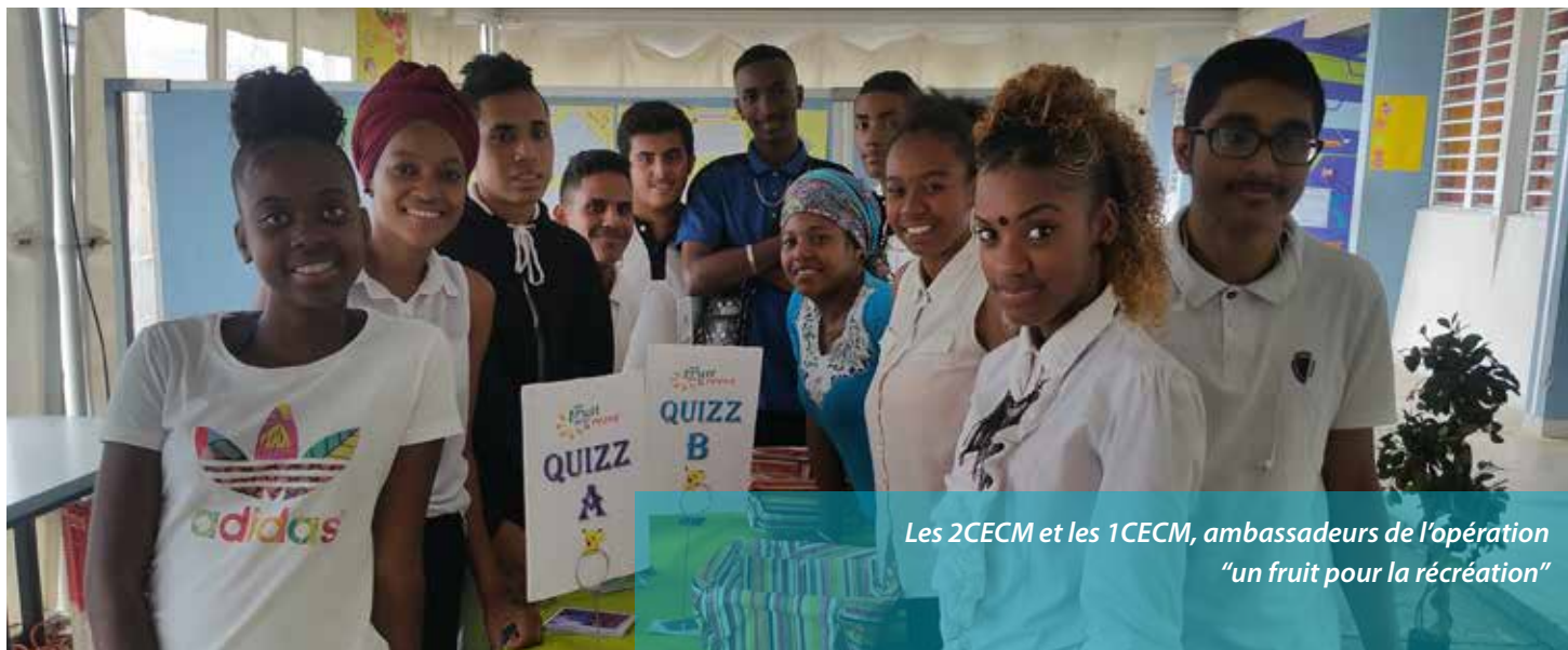
Les 2CECM et les 1CECM, ambassadeurs de l'opération "un fruit pour la récréation"

L'opération "un fruit pour la récré" ne se cantonne pas à la mise en place de stands d'informations. En effet, depuis plusieurs semaines, les élèves de CAP ECMS travaillent sur le planning de distribution de fruits. La distribution de fruits a été réalisée sur 7 jours (2,6,7,9,10,12,13), tous les élèves du lycée des classes de seconde bac professionnel et première année de CAP auront droit à un fruit pendant la récréation.