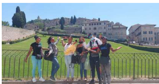
Visite de la ville de Pérouse