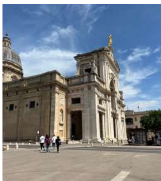
Visite de l'église de Santa Maria

L'après-midi, ils se sont rendus à la Basilique de Saint-François d'Assise : lieu historique de la ville.