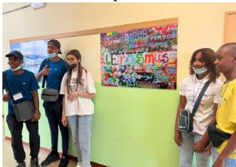
Visite de l'école Santa Maria

Mardi 24 mai 2022 : Matinée à l'école Centrale de Santa Maria. Rencontre avec les autres représentants des pays partenaires : la Roumanie, le Portugal ainsi que l'Italie. Lors de ce premier échange, chaque partenaire s'est présenté (professeurs et élèves) et les partenaires ont pu échanger autour d'un pot de bienvenue. Ils ont aussi visité l'établissement ainsi que ses différents laboratoires. D'ailleurs, les élèves ont pu participer à un cours de physique-chimie en anglais. Ce lycée propose aussi des formations dans les domaines de l'électricité et de la mécanique.