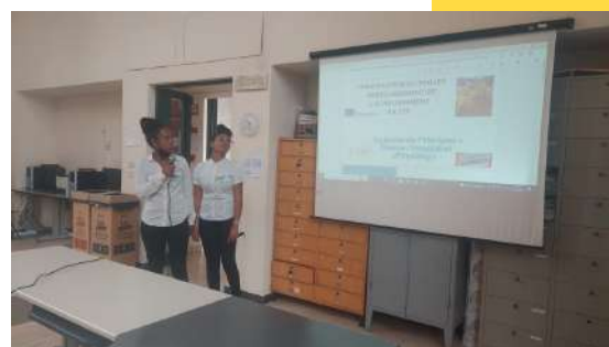
Présentation du projet embellissement du LP Horizon

Ensuite, ils ont été reçus par la responsable de la Mairie de BASTIA. Chaque partenaire a reçu un fanion représentant leur village. Ensuite, ils sont revenus au lycée de Bastia pour la pause déjeuner autour d'un repas partagé avec les spécialités de l'Italie. Ils ont terminé le déjeuner dans une ambiance musicale par la découverte de musiques et de danses spécifiques à chaque pays.